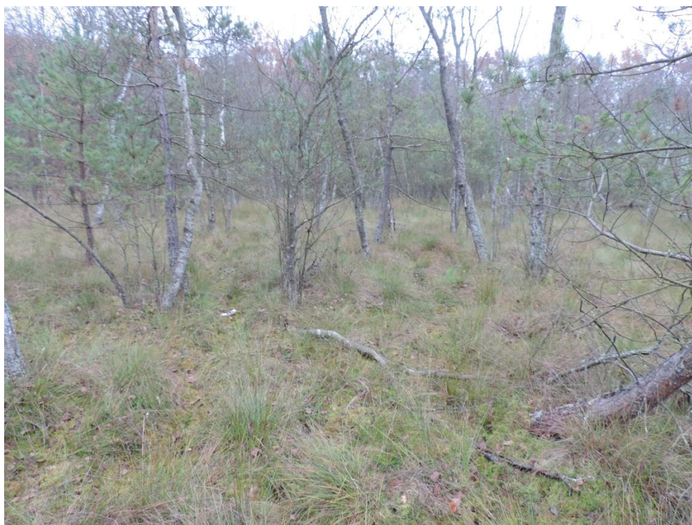
Fot. 15. Torfowisko mszarne na wschód od Rusowa

Zaprzestanie koszenia (przynajmniej raz w roku) i nawożenia łąk powoduje spadek ich różnorodności florystycznej. Z kolei intensyfikacja nawożenia, wypasu i zabiegów agrotechnicznych skutkuje ujednoliceniem składu, w którym dominują pojedyncze gatunki traw.