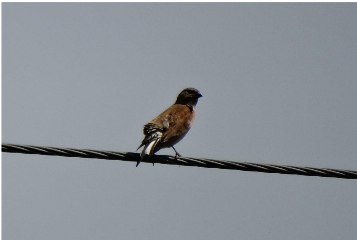
Fot. 30. Makolągwa Carduelis cannabina

Szczygieł Carduelis carduelis . Ochrona ścisła. W 2014 r. lęgowa na całym obszarze.