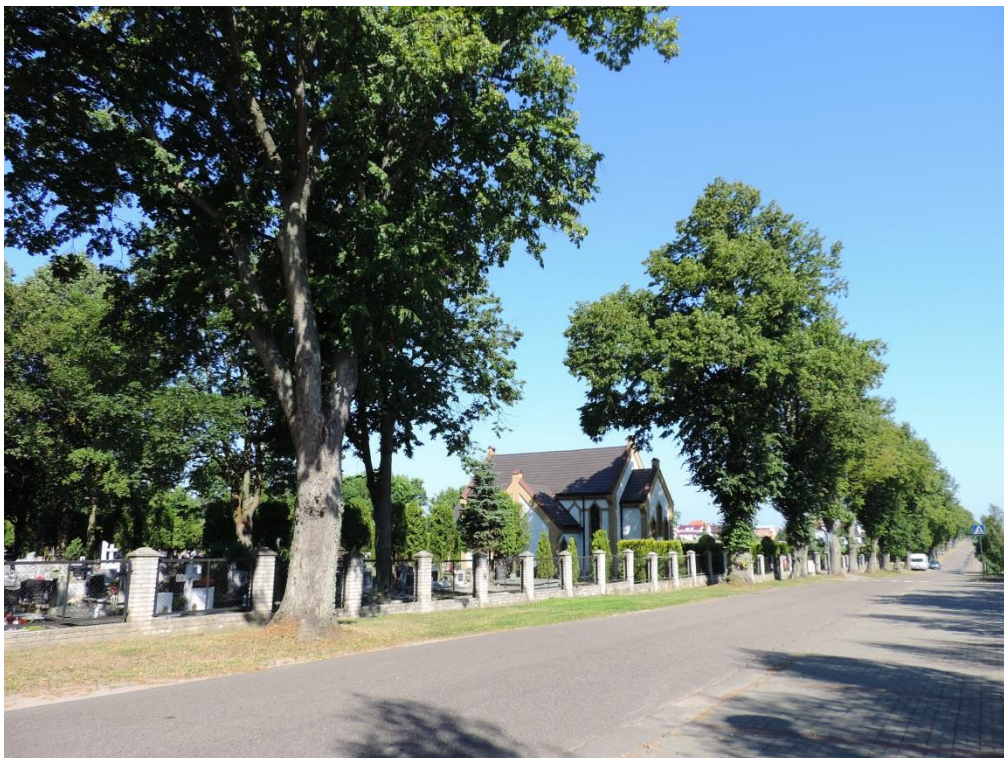
Fot. 22. Cmentarz komunalny w Ustroniu Morskim