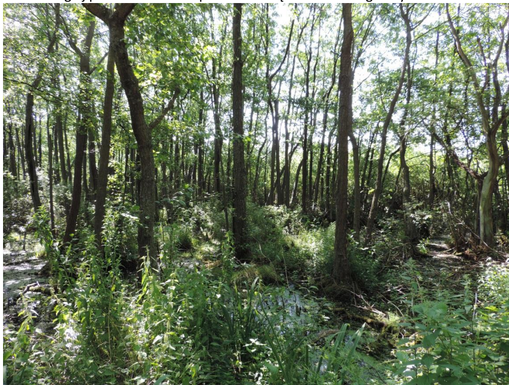
Fot. 7. Olszyna bagienna między lotniskiem w Bagiczu i brzegiem morskim

Typowe dla ubogich siedlisk lasy z klasy Vaccinio-Piceetea zajmują w gminie niewielkie powierzchnie. Na rozległym złożu torfu na północ od Kukini z powodu silnego odwodnienia i zmurszenia torfu, potencjalne siedlisko bagiennych borów porasta bardzo zdegradowana brzezina bagienna. W drzewostanie panującym brzoza (brodawkowatej Betula pendula i omszonej B. pubescens ) towarzyszą dęby szypułkowe Quercus robur , sosny Pinus sylvestris , osiki Populus tremula . Gesty podszyt tworzą jarzębiny Sorbus aucuparia i kruszyna pospolita Frangula alnus . W runie dominują jeżyny Rubus sp. i trzęślica modra. Poza tym rosną tu licznie takie gatunki jak: borówka czarna vaccinium myrtillus , śmiałek pogięty Deschampsia flexuosa , trzcinnik piaskowy Calamagrostis epigejos , sit rozpierzchły Juncus effusus , tojeść pospolita Lysimachia vulgaris , nerecznica krótkokostna Dryopteris carthusiana . Brak gatunków typowych dla borów bagiennych, choć jeszcze w drugiej połowie XX wieku podawano stąd wrzosiec bagieny.