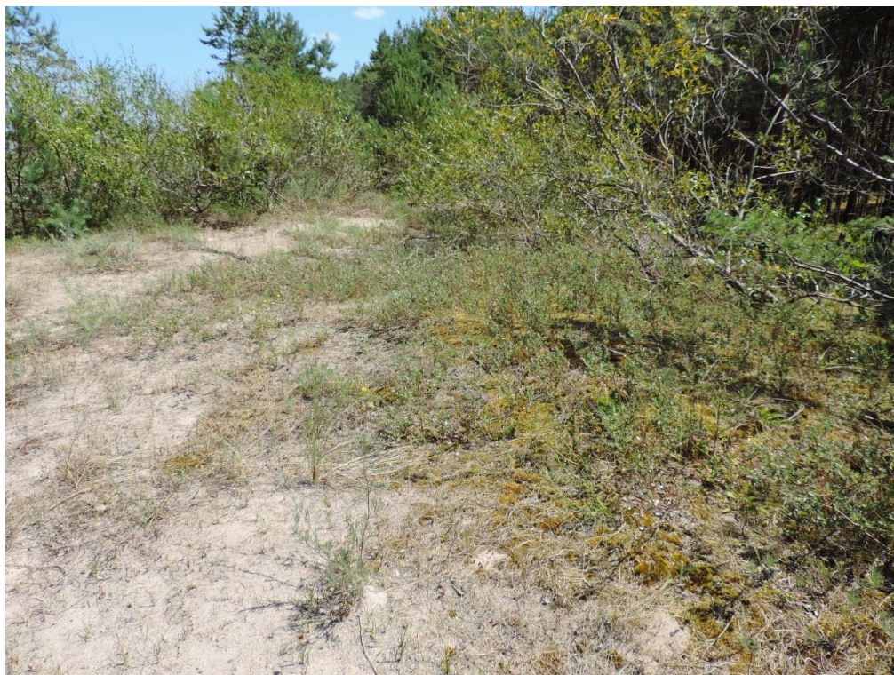
Fot. 13. Wydma szara nad Bałtykiem przy wschodniej granicy gminy Ustronie Morskie

luźno rosnące okazy sosen i niestety było one zalesiane przez inwazyjną wierzbę wawrzynkową Salix daphnoides .