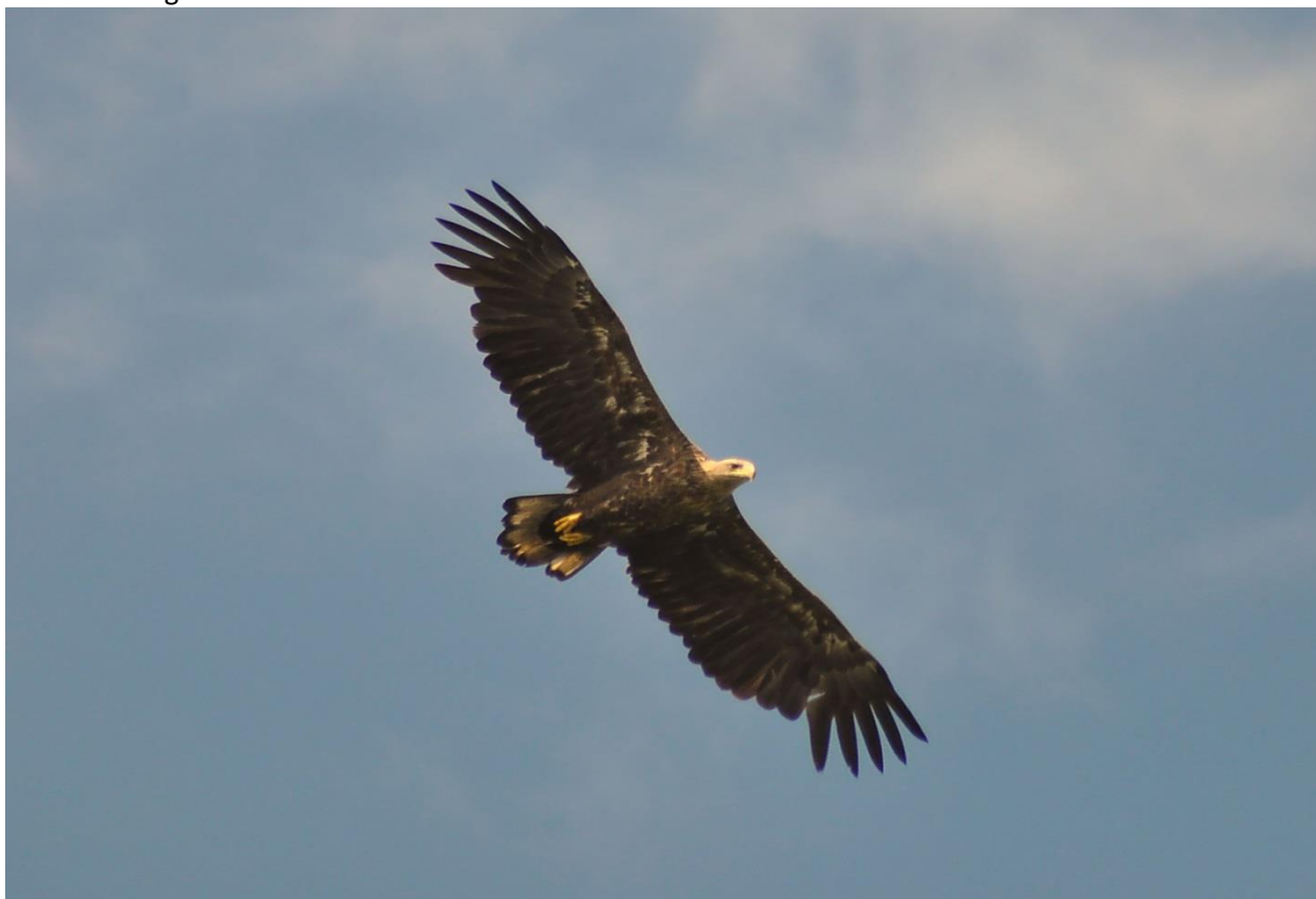
Fot. 26. Bielik Haliaeetus albicilla

Bielik Haliaeetus albicilla . Umieszczony w Załączniku I Dyrektywy Ptasiej. PCKZ LC - gatunek o nieokreślonym statusie, (jako lęgowy). Czerwona lista zwierząt LC - gatunek najmniejszej troski. Ochrona ścisła. Nielęgowy. Poza okresem lęgowym obserwowany przy południowej części Kołobrzeskiego Lasu.