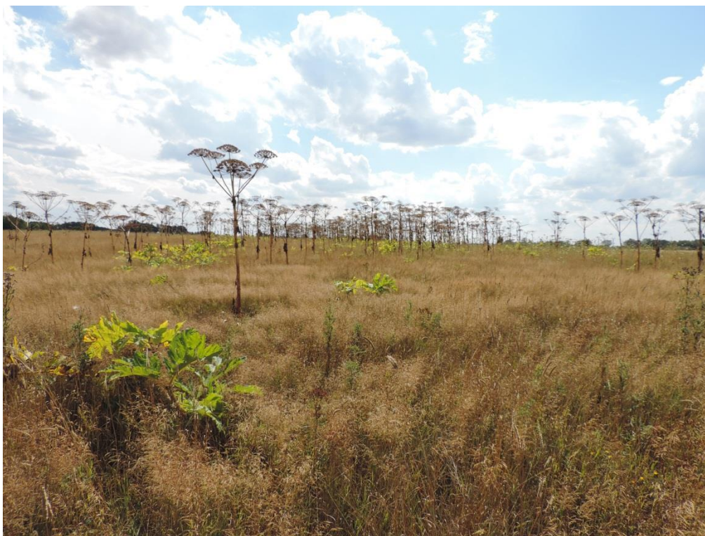
Fot. 5. Odłogi porośnięte barszczem Sosnowskiego na północny wschód od Kukinii