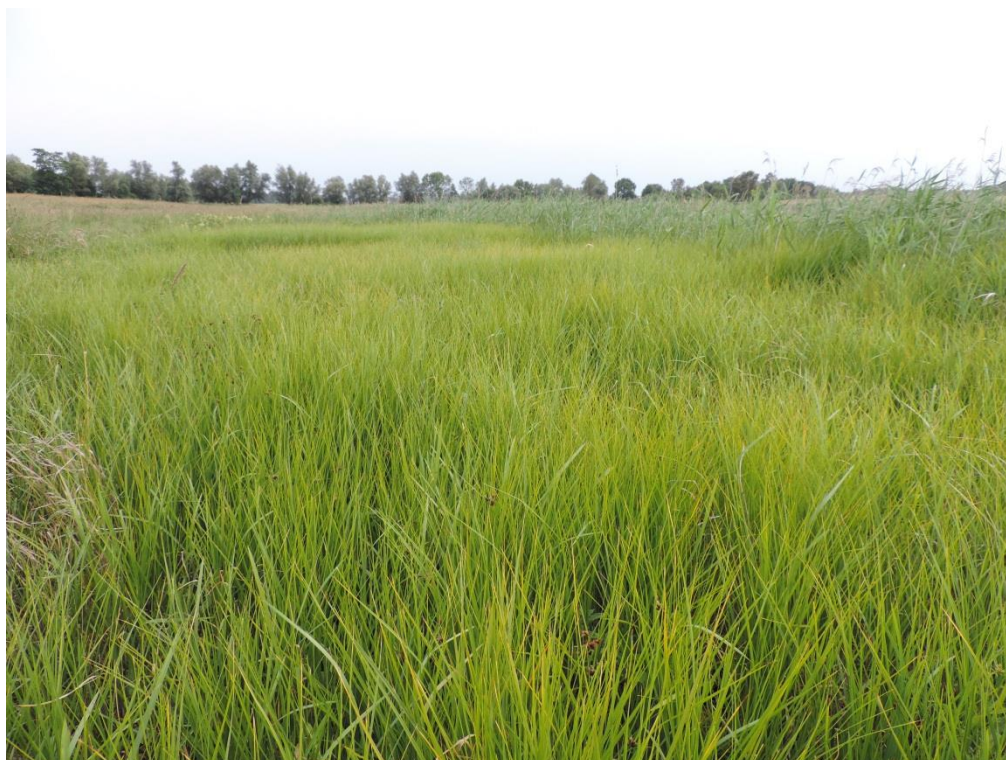
Fot. 14. Półhalofilny szuwar sitowca nadmorskiego na łąkach Łasińskich

Łasińskich. Płaty te nawiązują do podtypu 1340-3 halofilny szuwar z sitowcem nadmorskim, jednak stanowią niemal jednogatunkowe agregacje. Brak w gminie innych gatunków solniskowych (poza zasiedlającymi plażę i wydmy).