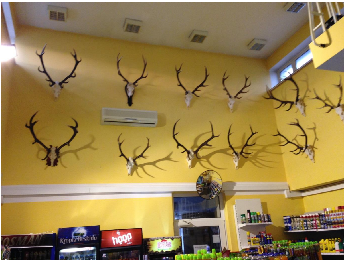
Fot. 31. Kolekcja zbiorów faunistycznych na stacji paliw

Jedyna stwierdzona kolekcja fauny to 13 sztuk poroży jeleni znajdujące się na stacji BP w Ustroniu Morskim.