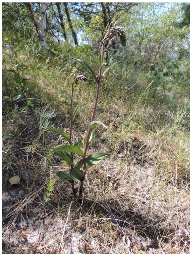
Fot. 2. Kruszczyk rdzawoczerwony rosnący na wydmie na wschód od Ustronia Morskiego

Z grupy gatunków częściowo chronionych do wymierających na Pomorzu Zachodnim (Żukowski, Jackowiak 1995) zaliczono turówkę wonną Hierochloe odorata i podkolana zielonawego Platanthera chlorantha .