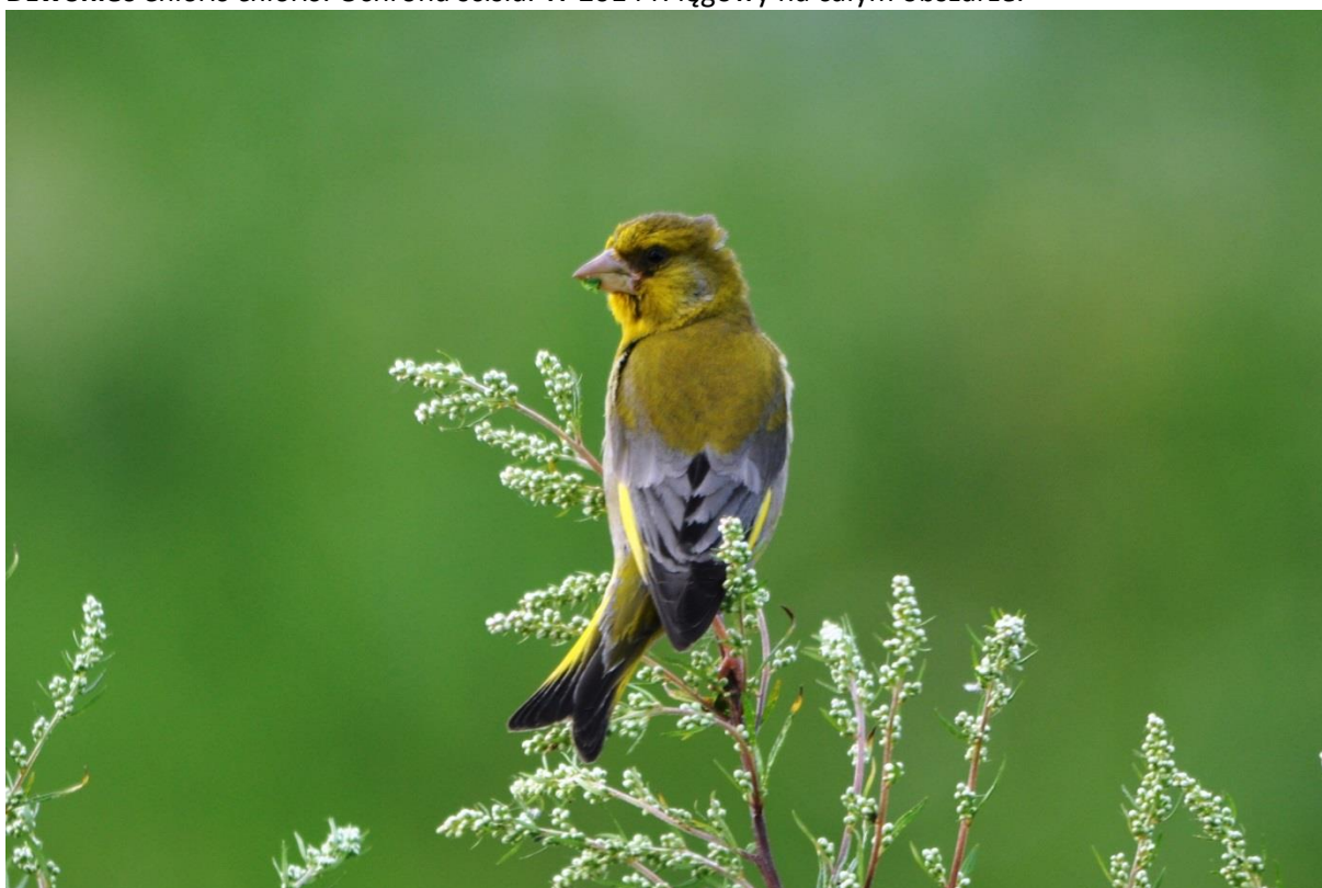
Fot. 29. Dzwoniec Chloris chloris .

Dzwoniec Chloris chloris . Ochrona ścisła. W 2014 r. lęgowy na całym obszarze.