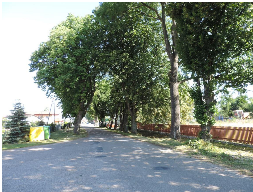
Fot. 21. Aleja kasztanowców zwyczajnych przy stacji kolejowej w Ustroniu Morskim

Inne efektowne aleje ciągną się wzdłuż ulicy pomocniczej biegnącej po południowej stronie lotniska w Bagiczu oraz wzdłuż drogi z Rusowa do Strachomina.