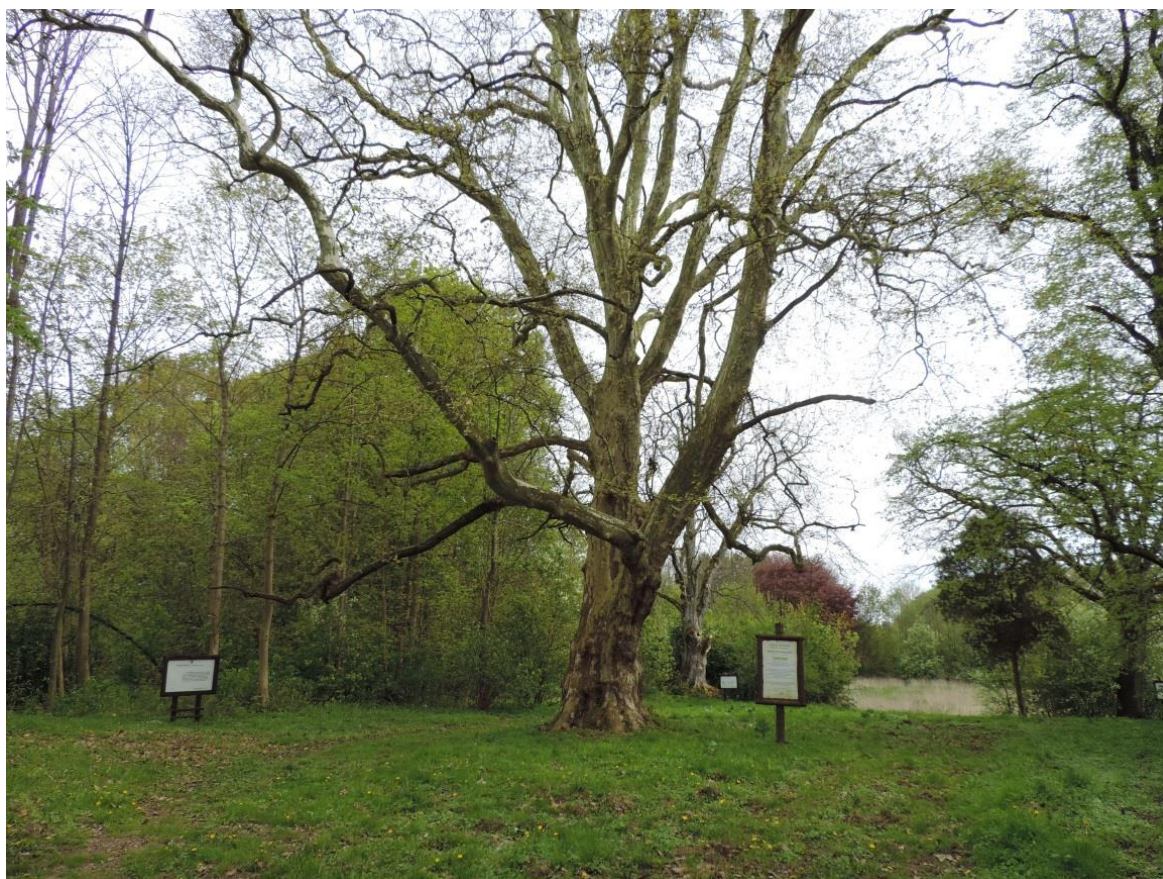
Fot. 18. Pomnikowy platan i inne okazałe drzewa w parku w Rusowie