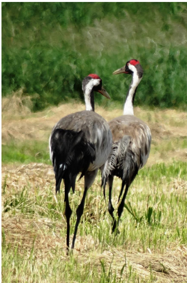
Fot. 27. Żuraw Grus grus

Ochrona ścisła, wymaga ochrony czynnej. W 2014 r. lęgowy tylko na terenie Kołobrzeskiego Lasu - w liczbie co najmniej 2 par.