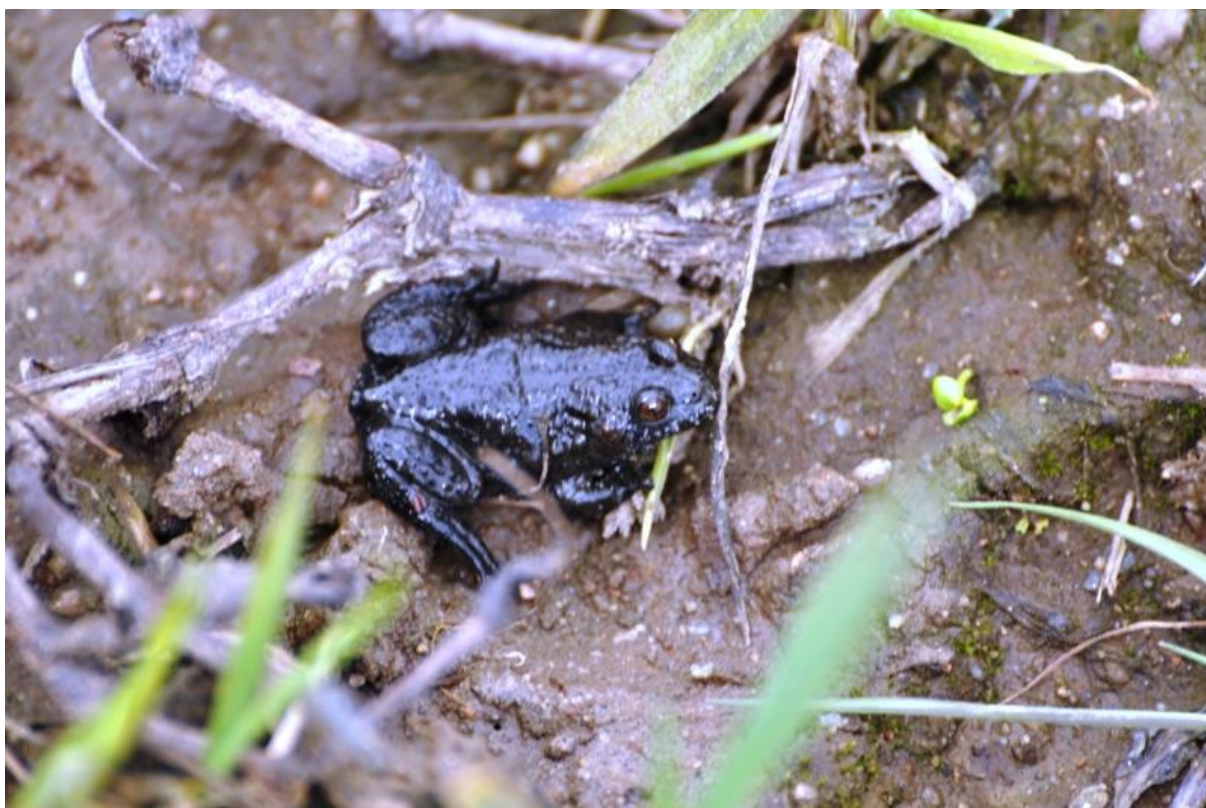
Fot. 25. Kumak nizinny Bombina bombina

Kumak nizinny Bombina bombina . Podawany z polnego oczka wodnego na południowy-wschód od Rusowa (WPGU 1 , PPK). Umieszczony w Załączniku II Dyrektywy Siedliskowej. PCLZ DD - zagrożenie niezdefiniowane. Ochrona ścisła, wymaga ochrony czynnej. W 2014 r. nie stwierdzony.