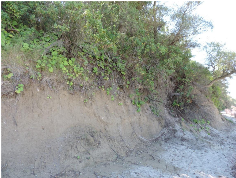
Fot. 11. Klif gliniasty w Sianożętach

z rokitnikiem Hippophæ rhamnoides , jarzębiną Sorbus aucuparia i różą dziką Rosa canina , często też z inwazyjną różą pomarszczoną R. rugosa . Na lekko zasadowym podłożu klifów osypiskowych wykształcają się zbiorowiska inicjalne z koniczyną łąkową Trifolium pratense i przelotem zwyczajnym Anthylis vulneraria . Klify martwe (1230-2), leżące poza zasięgiem fal powstają w wyniku zabudowy hydrotechnicznej brzegu morskiego i podstawy klifu. Działania takie wiążą się zwykle także z formowaniem i obsadzeniem klifu gatunkami zapobiegającymi erozji, co na przykładzie odcinka klifów wzdłuż Ustronia Morskiego oznacza w zasadzie likwidację naturalnych cech siedliska.