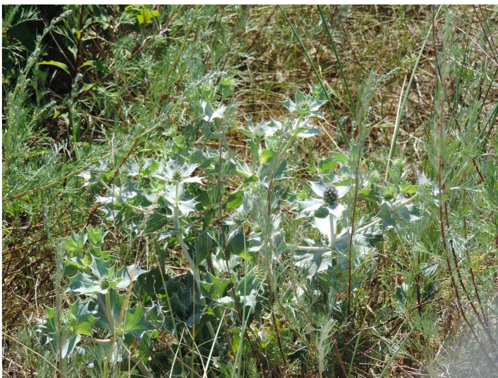
Fot. 1. Mikołajek nadmorski rosnący na wydymie na wschód od Ustronia Morskiego

W Gminie Ustronie Morskie stwierdzono 6 gatunków objętych ścisłą ochroną prawną. Dwa z nich zaginęły (wrzosiec bagienny i bagnica torfowa), a pozostałe notowane były na pojedynczych stanowiskach. Interesujące jest występowanie mikołajka nadmorskiego Eryngium maritimum , którego pojedynczy egzemplarz odnaleziono po raz pierwszy na terenie gminy przy ogrodzeniu na wydymie na terenie wojskowym koło Wieniotowa. Według informacji niepublikowanych uzyskanych od mieszkańców gminy gatunek ten w przeszłości występował tu „dość licznie”.