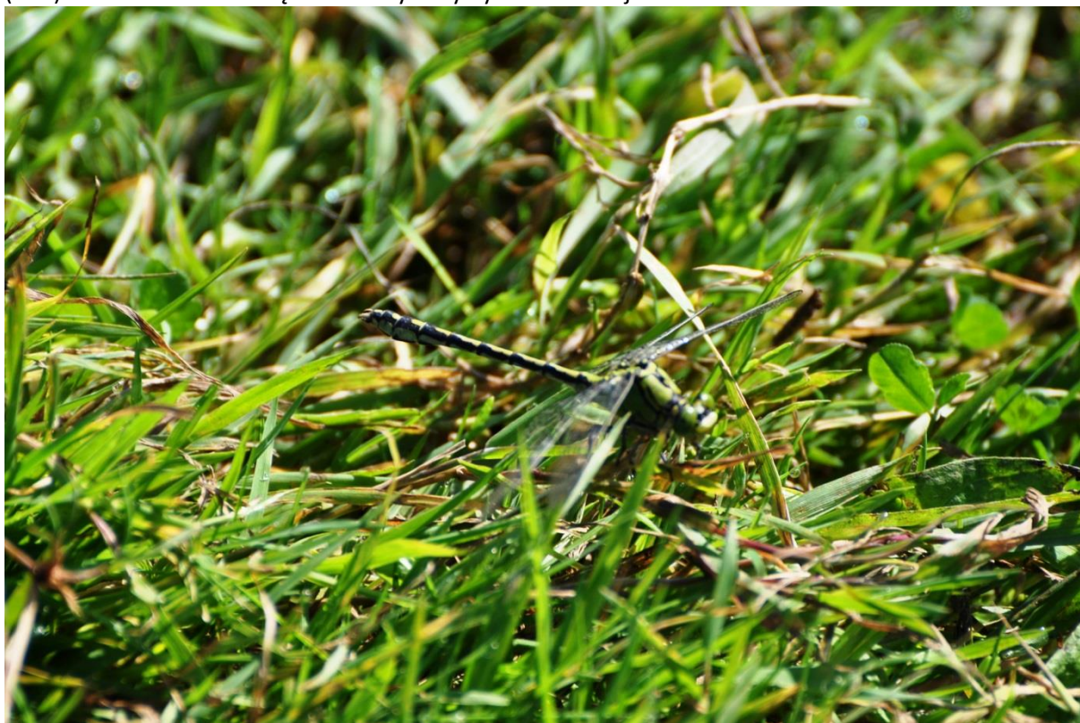
Fot. 24. Trzepla zielona Ophiogomphus cecilia

Trzepla zielona Ophiogomphus cecilia . Podawana jako liczna w Kołobrzieskim Lesie - 2007, 2010, 2012 (PPK). Umieszczona w Załączniku II Dyrektywy Siedliskowej. Ochrona ścisła.