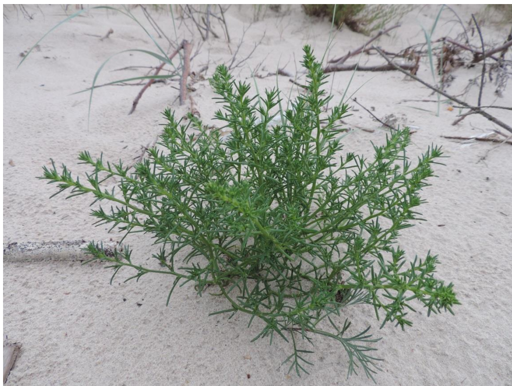
Fot. 3. Solanka kolczysta rosnąca u podnóża wydym na wschód od Ustronia Morskiego

Po wyłączeniu gatunków chronionych we florze gminy pozostaje 29 gatunków zagrożonych, z czego aż 20 notowanych było bardzo rzadko – na 1-3 stanowiskach. Do najrzadszych w gminie należą: czerniec gronkowy Actaea spicata , łoboda nadbrzeżna Atriplex littoralis , stokłosa żytnia Bromus secalinus , rzęśl hakowata Callitriche hamulata , turzyca bagienna Carex limosa (nie odnaleziona w 2014), szczywół plamisty Conium maculatum , kokorycz wątła Corydalis intermedia , narecznica grzebieniasta Dryopteris cristata , bodziszek leśny Geranium sylvaticum , manna gajowa Glyceria nemoralis , widłak wroniec Huperzia selago , dziurawiec rozestany Hypericum humifusum , lilia bulwkowa Lilium bulbiferum , topola czarna Populus nigra , rdestnica Berchtolda Potamogeton berchtoldii , solanka kolczysta Salsola kali , driakiew gołębia Scabiosa columbaria , fiołek przedziwny Viola mirabilis .