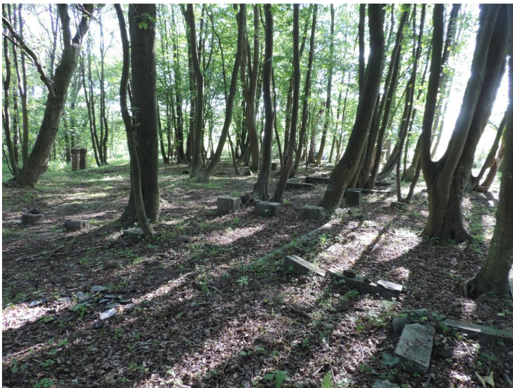
Fot. 20. Nieczynny cmentarz w Bagiczu

Bagicz dz. nr 63 – nieczynny cmentarz ewangelicki. Przy drodze dojazdowej do lotniska stare jawory Acer pseudoplatanus i kasztanowce Aesculus hippocastanus , w środku młody drzewostan jaworów z domieszką grabów Carpinus betulus , pojedyncze brzozy Betula pendula , olsze czarne Alnus glutinosa świerki Picea abies . Zachowane ruiny i postumenty nagrobków, układ alei zatarty. Teren