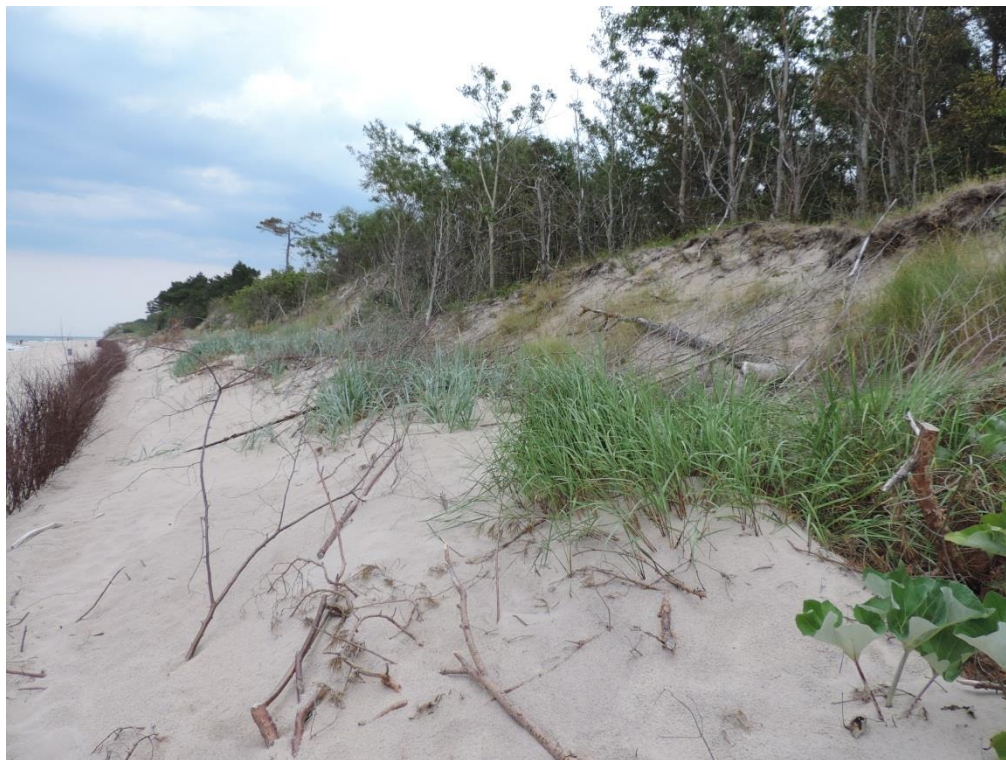
Fot. 12. Wydma biała z wydmuchrzycą i piaskownicą na wschód od Ustronia Morskiego

w gminie). Największy problem w ochronie tego siedliska paradoksalnie stanowią działania zmierzające do ochrony wybrzeża. Obecne gatunki krzewów wprowadzane na wydmy w celu ich stabilizacji (zwłaszcza wierzba wawrzynkowa i róża pomarszczona) powodują akumulację próchnicy i przyspieszoną sukcesję skutkującą kształtowaniem warunków siedliskowych typowych dla wydm szarych. Zwarte zarośla gatunków inwazyjnych eliminują przy tym wszelką roślinność typową dla wydm, ewentualnie ograniczają jej miejsca występowania do luk wśród zakrzaczeń. W obrębie gminy wydmy białe występują na wschód od Ustronia Morskiego, przy czym tworzą zarówno niski wał na zapleczu plaży, jak i potężny i na ogół zalesiony wał, podcięty działaniem abrazyjnym morza.