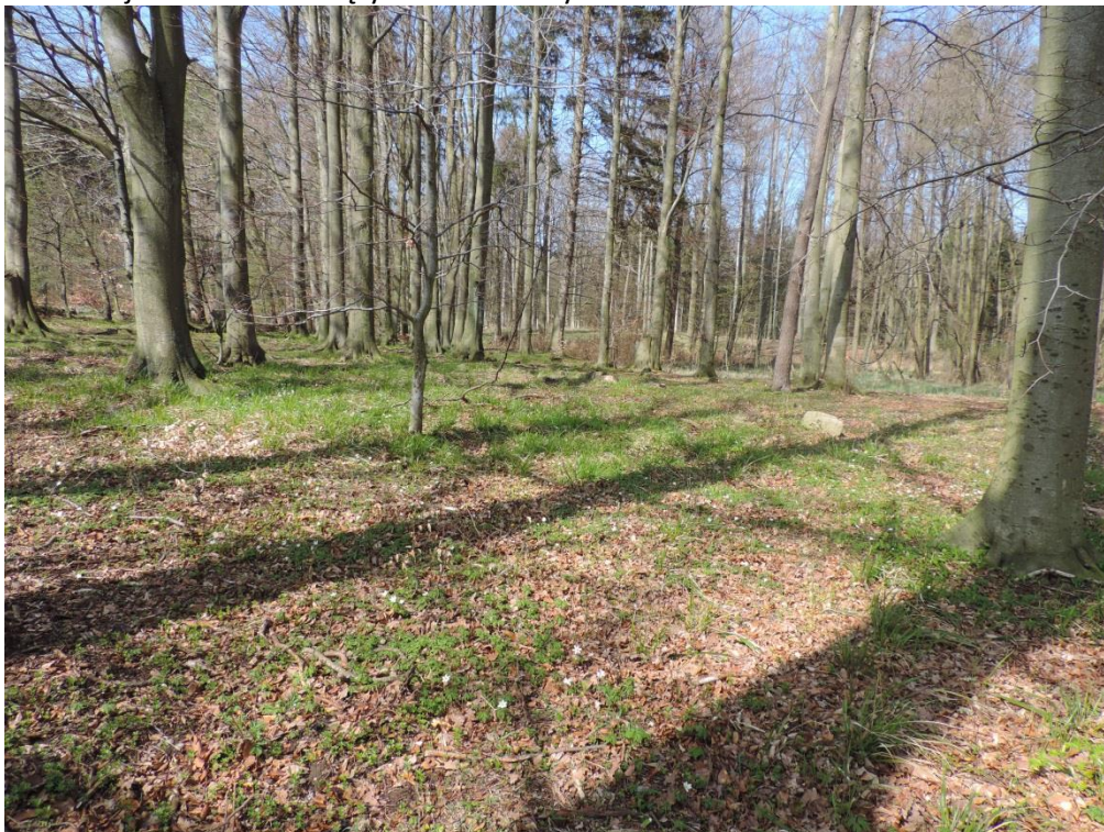
Fot. 6. Żyzna buczyna w Lesie Kołobrzeskim

Powierzchniowo dominują w lasach gminy siedliska żyznych i kwaśnych buczyn niżowych. Zaskakuje nieco duży areal tych drugich, bowiem w dotychczasowych inwentaryzacjach zbiorowiska te nie były stąd wykazywane, jako istotny składnik pokrywy roślinnej. Żyzne lasy liściaste obejmujące obok buczyn, także łęgi, olsy i grądy tworzą w gminie dwa duże kompleksy leśne – Las Kołobrzeski w części zachodniej i Las Łasiński w części wschodniej. Mniejsze kompleksy lasów poza nimi obejmują siedliska grądowe, bagienne i lasów nadmorskich. Niewielki płat buczyny znajduje się tylko nad klifem na zachód od miejscowości Sianożęty oraz w okolicy Rusowa.