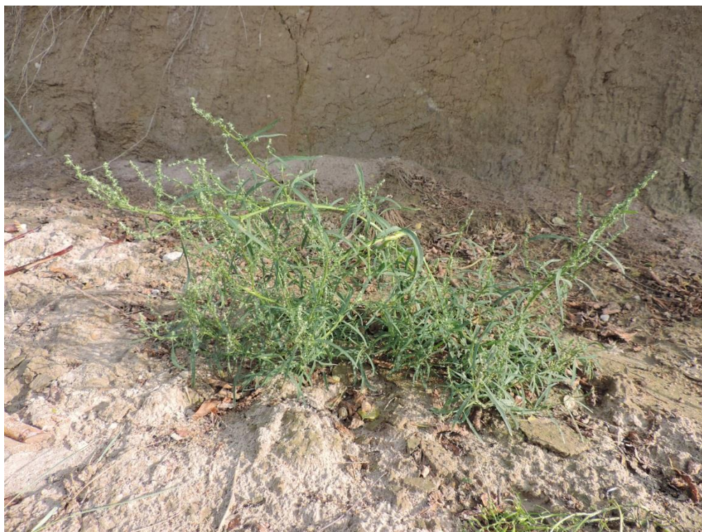
Fot. 10. Łoboda nadbrzeżna u podnóża klifu w Sianożętach

Kidzina na brzegu morskim (kod 1210). Siedlisko powstające w wyniku osadzania na piaszczystych plażach szczątków roślin morskich oraz kawałków drewna i innych materiałów organicznych przynoszonych do morza przez rzeki. Jest to siedlisko nietrwałe, o zmiennym rozmieszczeniu, niszczone przez silne sztormy, stąd co roku odtwarzane na nowo. Zasiedlane jest tylko przez rośliny roczne, o krótkim cyklu życiowym, preferujące siedlisko równocześnie bogate w azot (z rozkładających się szczątków roślin) i zasolone. Spotyka się tu kilka gatunków łobod: nadbrzeżną A. littoralis (stwierdzona na pojedynczych stanowiskach koło Sianożęt), ościcowatą odmianę solnej Atriplex prostrata var. salina , poza tym: rukwiel nadmorską Cakile maritima , marunę nadmorską Matricaria maritima ssp. maritima i solankę kolczystą Salsola kali ssp. kali . Rośliny te tworzą ubogie zbiorowiska o niewielkim stopniu pokrycia, często po prostu rosną pojedynczo. Kidzina może występować wzdłuż całego brzegu morskiego, jednak ze względu na intensywne użytkowanie rekreacyjne w obszarze opracowania wykształca się szczątkowo. Największym problemem w zachowaniu tego siedliska jest usuwanie kidziny podczas czyszczenia plaż.