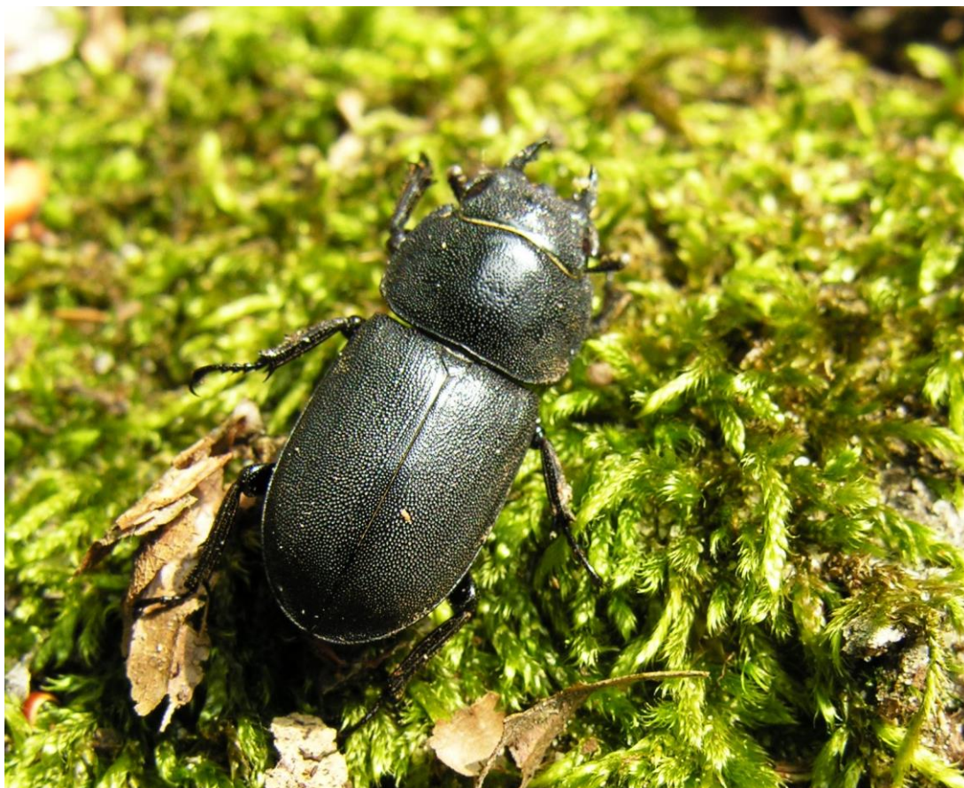
Fot. 23. Ciołek matowy Dorcus parallelipedus

Ciołek matowy Dorcus parallelipedus . Podawany z terenu całego nadleśnictwa (POP) i Kołobrzeskiego Lasu - 2011 r. (PPK). PCLZ VU - narażony. Objęty ochroną do zmiany Rozporządzenia w 2014 r.