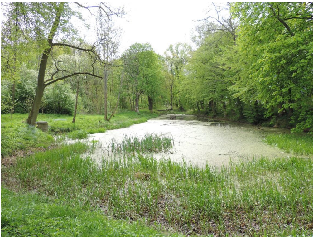
Fot. 19. Staw w parku w Rusowie