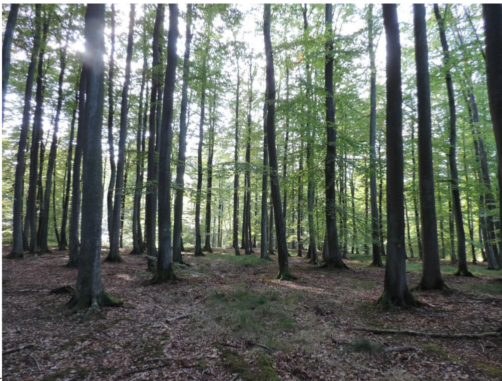
Fot. 16. Kwaśna buczyna w Lesie Kołobrzescim

w przypadku torfowisk przejściowych – ulegają przy tym sukcesji w kierunku brzezin bagiennych. Większy płat dobrze zachowanego mszaru typowego dla torfowiska przejściowego występuje na mokradle na wschód od Rusowa. Występuje tu zbiorowisko Sphagnum recurvum - Eriophorum angustifolium z jednolitą warstwą mszystą, budowaną niemal wyłącznie przez torfowca Sphagnum fallax z warstwą zielną zdominowaną przez wełniankę wąskolistną i żurawinę błotną Vaccinium uliginosum . Niewielkie mszary w Lesie Kołobrzescim poprzerastane są turzycą nitkowatą Carex lasiocarpa , turzycą dzióbkowatą Carex rostrata i sitem rozpięzłym Juncus effusus . Miejscami na obrzeżach występują niewielkie, ale malownicze płaty z dominacją płonnika pospolitego Polytrichum commune .