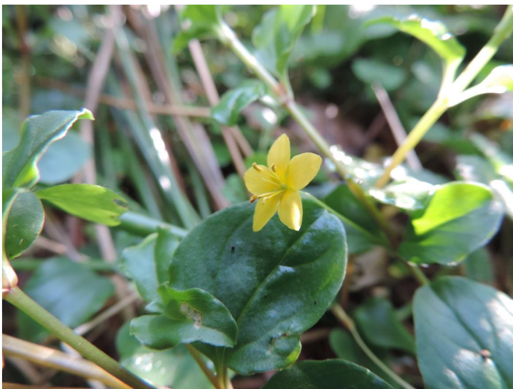
Fot. 4. Tojeść gajowa – lokalnie gatunek częsty w Lesie Kołobrzесьkim