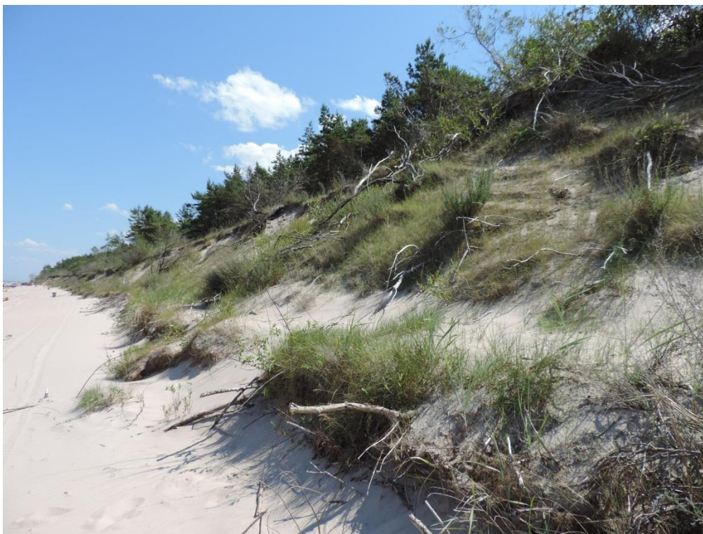
Fot. 8. Podcięty abrazyjnie wał wydymowy na wschód od Ustronia Morskiego

Wzdłuż wybrzeża Bałtyku w gminie Ustronie Morskie dominują gleby gliniaste i piaszczyste podcinane działaniem erozyjnym morza w formę niskich klifów. Odcinki w rejonie Ustronia Morskiego są silnie przekształcone z powodu zabudowy hydrotechnicznej i tu nie występują zbiorowiska inne od antropogenicznych nasadzeń zarośli ponad skarpami z gwiazdobloków.