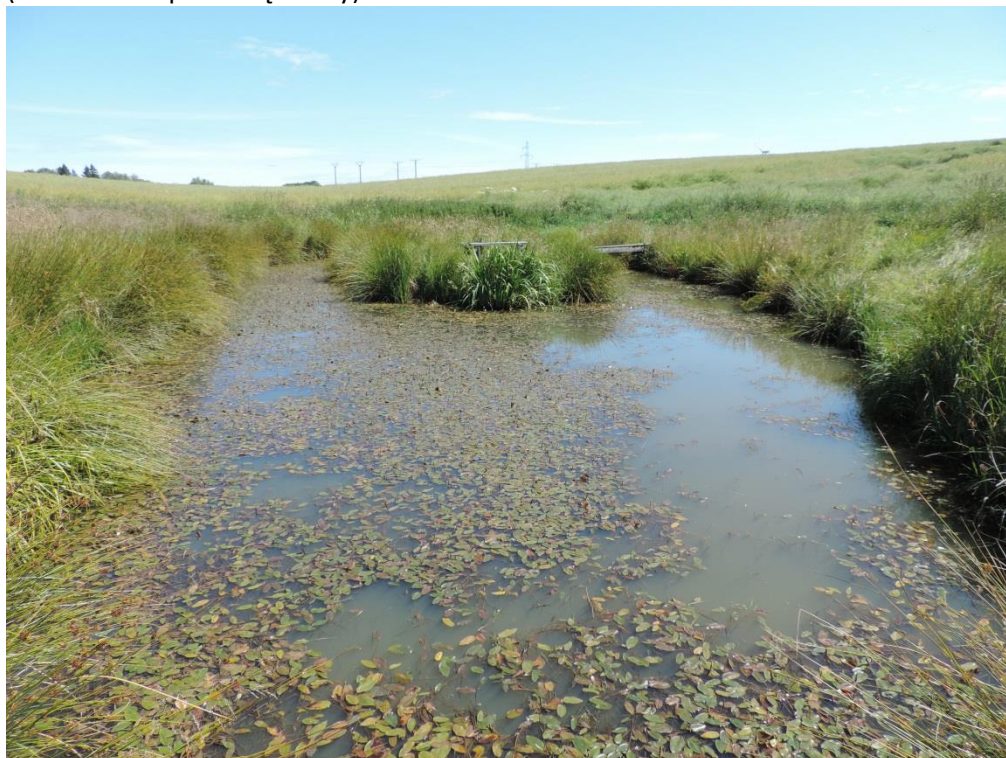
Fot. 9. Zbiorowisko rdestnicy pływającej w stawie śródpolnym koło miejscowości Gwizd

Zbiorowisk makrohydrofitów z grzybieniami białymi Nymphaea alba wykształcają się w zbiorniku eutroficznym na północnym skraju Lasu Łasińskiego (oddz. 304), na stawach w zachodniej części Lasu Kołobrzeskiego oraz w jeziorku dystroficznym na torfowisku na wschód od Rusowa (tu niszczone przez wędkarzy).