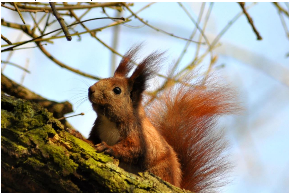
Fot. 32. Wiewiórka pospolita Sciurus vulgaris

Wiewiórka pospolita Sciurus vulgaris . Podawana z Kołobrzесьkiego Lasu (WPMK). Podawana z terenu Nadleśnictwa (POP). Ochrona częściowa.