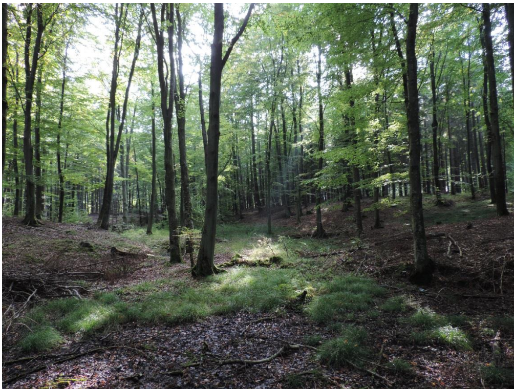
Fot. 17. Subatlantycki łęg jesionowy w Lesie Kołobrzeskim

łęgi wierzbowe, topolowe, olszowe i jesionowe Salicetum albo-fragilis , Populetum albae , Alnenion glutinoso-incanae , olsy źródłiskowe (kod 91E0) – siedlisko priorytetowe. Lasy wykształcające się na glebach zalewanych wodami płynącymi, o wysokim poziomie wód gruntowych występują w gminie stosunkowo często, jednak z racji kształtowania się w wąskich dolinach mniejszymi rzek i strumieniami – zajmują stosunkowo niewielkie powierzchnie.