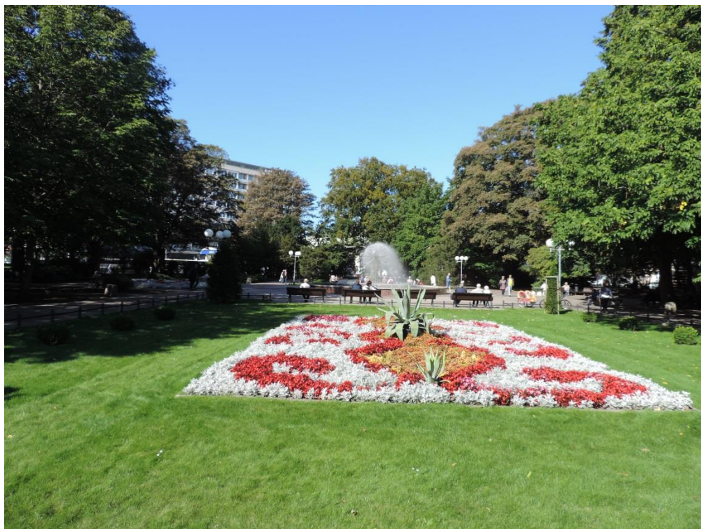
Fot. 22. Park 18 marca