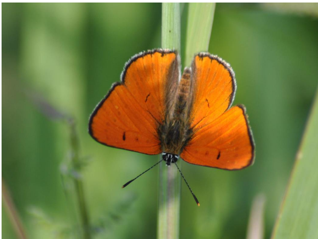
Fot. 27. Czerwończyk nieparek Lycaena dispar

Enochrus bicolor . Podawany z solniska w dolinie Stramniczki w rejonie Budzistowa - 2005 (PPK). PCLZ EN - zagrożony.