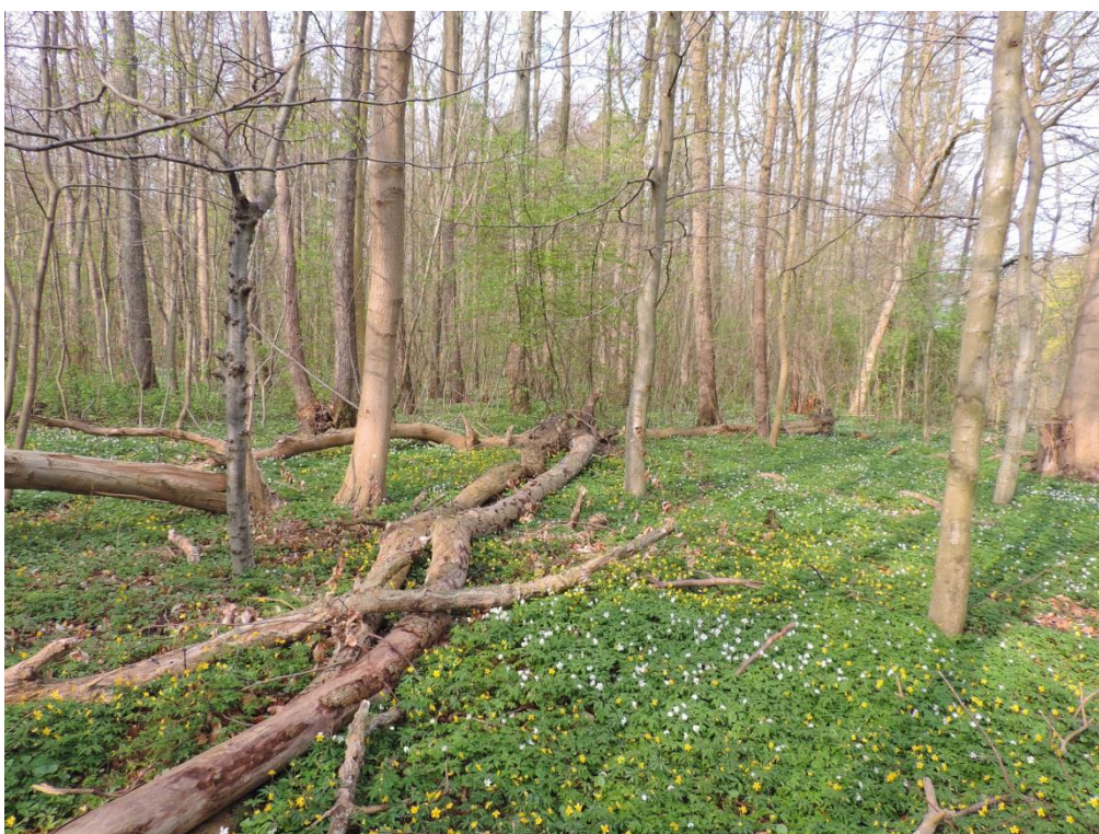
Fot. 12. Grąd subatlantycki na południowy wschód od Podczela