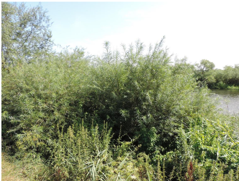
Fot. 20. Zarośla wierzbowe nad Parsętą na Wyspie Solnej

rośnie tu także olsza czarna. W podszycie występuje licznie kruszyna pospolita Frangula alnus . W runie o dużym zwarcu występują licznie mszaki (w tym torfowce) oraz trzęślica modra Molinia caerulea . Towarzyszą im: sit rozpięchły Juncus effusus , borówka czernica Vaccinium myrtillus , siódmaczek leśny Trientalis europaea oraz nerecznica krótkoostna Dryopteris carthusiana .