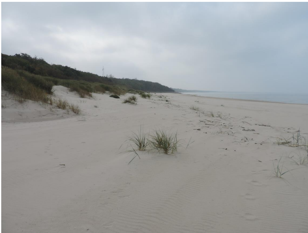
Fot. 17. Siedliska inicjalnych wydm białych na zachód od ujścia Parsęty

Największym zagrożeniem dla takich siedlisk jest ruch turystyczny oraz utrwalanie piasków przez nasadzenia i zabudowę techniczną brzegu.