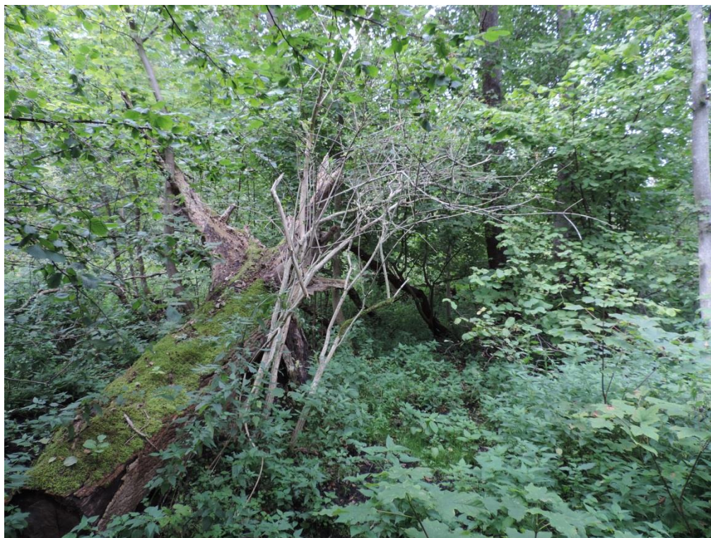
Fot. 9. Lasy łęgowe koło Podczela

Wykształca się w „Ekoparku Wschodnim” w kompleksie z olsem porzeczkowym, ale w miejscach bardziej przesuszonych. Płaty o przejściowym charakterze olsowo-łęgowym występują także w obniżeniach na południowym skraju kompleksu leśnego ciągnącego się wzdłuż brzegu morskiego w zachodniej części miasta oraz na zapleczu wały wydumowego w Ekoparku. W drzewostanie wydzielają się masowo jesiony, w efekcie w wielu miejscach rozwinął się bujny podrost olszy czarnej. Dobrze wykształcona warstwa krzewów, w której rosną m.in.: czeremcha pospolita Padus avium , bez czarny Sambucus nigra , leszczyna pospolita Corylus avellana , głóg jednoszyjkowy Crataegus monogyna , trzmielina zwyczajna Euonymus europaeus . W warstwie zielnej rzadko można spotkać m.in. żankiel zwyczajny Sanicula europaea , czworolist pospolity Paris quadrifolia , czartawę drobną Circaea alpina , przetacznik górski Veronica montana , a wiosną złoć pochwowatą Gagea spathacea .