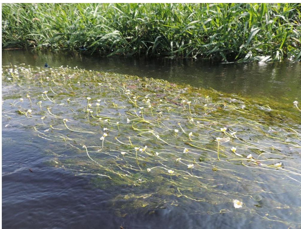
Fot. 3. Włosienicznik rzeczny – gatunek pod ochroną częściową w Parsęcie

We florze miasta jest 26 gatunków chronionych częściowo, z czego jeden – centurię nadobną Centaureum pulchellum , notowaną jeszcze w 60-tych latach XX wieku – uznano za wymarły. Najczęściej notowane na badanym obszarze były: turzyca piaskowa Carex arenaria , kruszczyk szerokolistny Epipactis helleborine , śnieżyczka przebiśnieg Galanthus nivalis , turówka wonna Hierochloa odorata , wiciokrzew pomorski Lonicera periclymenum oraz cis pospolity Taxus baccata . Większość gatunków notowana była bardzo rzadko, na 1-3 stanowiskach. Są to: centuria zwyczajna Centaureum erythraea , kukulka krwista Dactylorhiza incarnata , kukulka plamista Dactylorhiza maculata , groszek błotny Lathyrus palustris , śnieżyca wiosenna Leucoium vernum , bobrek trójlistkowy Menyanthes trifoliata , grzybienie białe Nymphaea alba , podkolan biały Platanthera bifolia , podkolan zielonawy Platanthera chlorantha oraz gruszyca mniejsza Pyrola minor . Spośród gatunków tej grupy za wymierające w skali regionalnej uznawane są dwa – turówka wonna Hierochloa odorata oraz podkolan zielonawy Platanthera chlorantha (Żukowski, Jackowiak 1997).