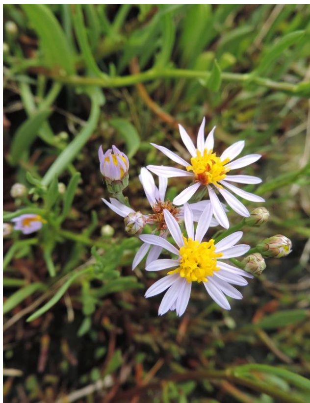
Fot. 1. Aster solny – gatunek pod ochroną ścisłą na solniku m. Kołobrzegiem i Budzistowem

W mieście Kołobrzeg stwierdzono 11 gatunków objętych ścisłą ochroną prawną. Najbardziej rozpowszechniony jest sadzony, łatwo dziczejący i w efekcie ekspansywny jarzab szwedzki Sorbus intermedia . Spośród gatunków solniskowych kilka jest względnie często notowanych, ale na ograniczonej powierzchni solnisk: aster solny Aster tripolium , mlecznik nadmorski Glaux maritima , soliród zielny Salicornia europaea , przy czym stanowiska roślin solniskowych koncentrują się na niewielkiej powierzchni. Pozostałe gatunki należą do bardzo rzadkich i były notowane na 1-3 stanowiskach. Dwa ściśle chronione gatunki – babka nadmorska Plantago maritima i jarzab szwedzki Sorbus intermedia figurują w Polskiej Czerwonej Księdze Roślin (Zarzycki, Kaźmierczakowa, 2001) jako gatunki narażone na wymarcie. Niemal wszystkie stwierdzone gatunki ściśle chronione figurują jednocześnie na czerwonej liście Pomorza Zachodniego (Żukowski, Jackowiak 1995). Wyjątkiem jest kukułka Fuchsa Dactylorhiza fuchsii .