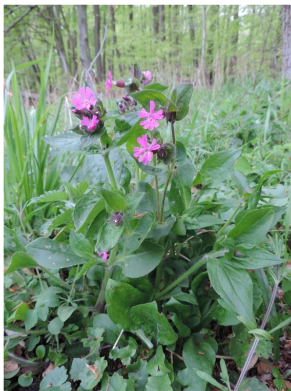
Fot. 5. Bniec czerwony w lasach koło Podczela