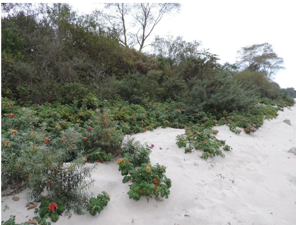
Fot. 8. Wydma biała zarośnięta różą pomarszczoną we wschodniej części Dzielnicy Uzdrawiskowej