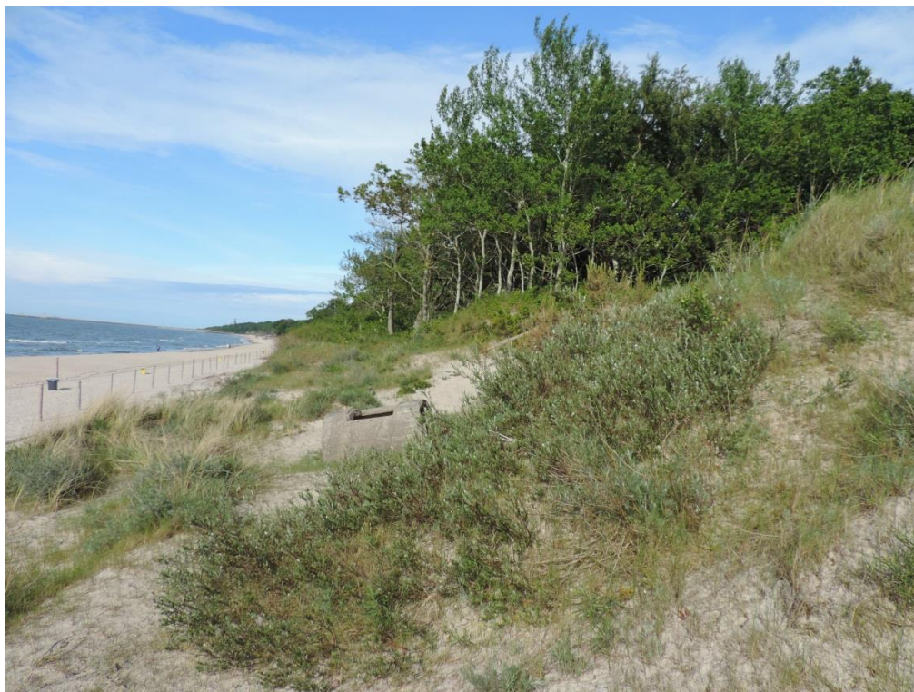
Fot. 13. Zarośla wierzby piaskowej na zachodnim krańcu miasta

Wykształca się w północno-zachodniej części miasta na zapleczu wzniesień wydmowych. Drzewostan tworzą: dąb szypułkowy Quercus robur , brzoza brodawkowata Betula pendula i omszona B. pubescens , jarzębina Sorbus aucuparia , topola osika Populus tremula oraz sosna pospolita Pinus sylvestris . W silnie rozwiniętej warstwie krzewów miejscami masowo występuje kruszyna pospolita Frangula alnus i wiciokrzew pomorski Lonicera periclymenum , poza tym: porzeczki – alpejska Ribes alpinum i dzika R. spicatum , bez czarny Sambucus nigra , głogi, leszczyna oraz malina właściwa. W wielogatunkowym runie rosną m.in.: konwalijka dwulistna Maianthemum bifolium , konwalia majowa Convallaria majalis , kokoryczka wielokwiatowa Polygonatum multiflorum , bodziszek cuchnący Geranium robertianum , prosownica rozpierzchła Millium effusum , kłosownica pierzasta Brachypodium sylvaticum i in. Zbiorowisko wyróżniane jest na siedliskach zróżnicowanych pod względem wilgotnościowym i pod względem żyzności. W miejscach bardziej żyznych kształtuje się jako wielogatunkowe zbiorowisko nawiązujące wręcz do lasów grądowych, ze szczególnie zróżnicowaną i bujną warstwą podszytu.