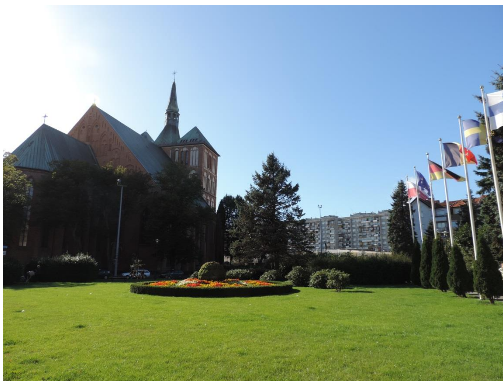
Fot. 25. Skwer miast partnerskich