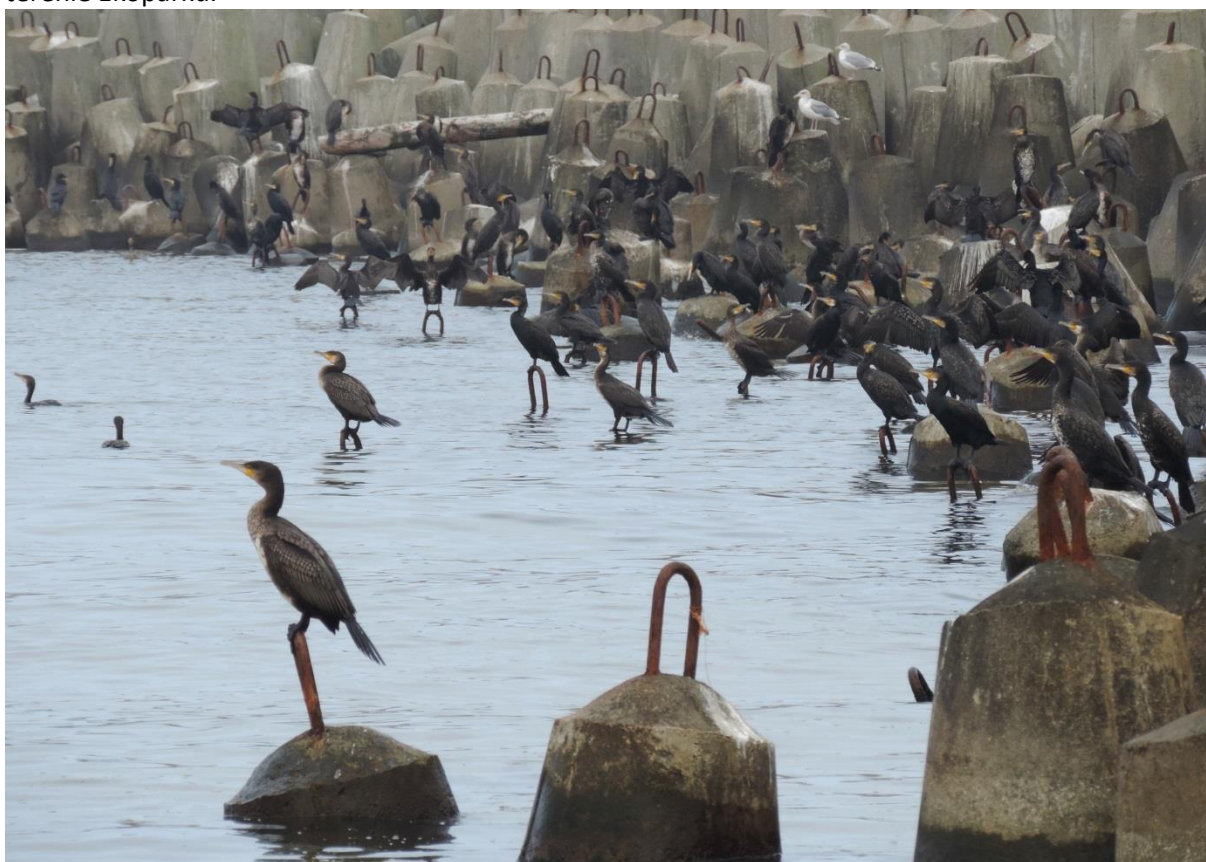
Fot. 30. Kormorany Phalacrocorax carbo na falochronie w Kołobrzegu

Kormoran Phalacrocorax carbo . Podawany przelotny i żerujący w estuarium Parsęty (WPMK) i w Ekoparku (E. W. Mrugowsky 2001). Ochrona częściowa. Nielęgowy. Spotykany przez cały rok pojedynczo i w migrujących grupach, najliczniej po zachodniej stronie falochronu w Kołobrzegu i na terenie Ekoparku.