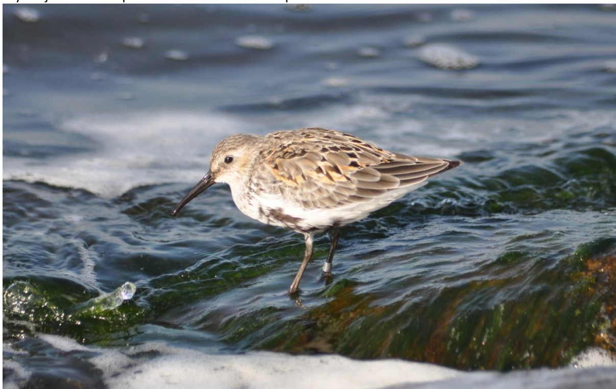
Fot. 28. Biegus zmienny Calidris alpina w rejonie Kołobrzegu

Biegus zmienny Calidris alpina . Para w ujściu Parsęty pod Kołobrzegiem w latach 1967-68 (Tomiałojć 1990). Przelotne podawano na plażach w Kołobrzegu oraz w Ekoparku (WPMK, Mrugowski et al. 2012). Do 50 os. w Ekoparku (E. W. Mrugowscy 2001, Mrugowski et al. 2013). PCKZ EN - silnie zagrożony (jako lęgowy). Czerwona lista zwierząt EN - zagrożony. Ochrona ścisła, wymaga ochrony czynnej. W 2014 r. przelotne notowane w Ekoparku - do 12 os.