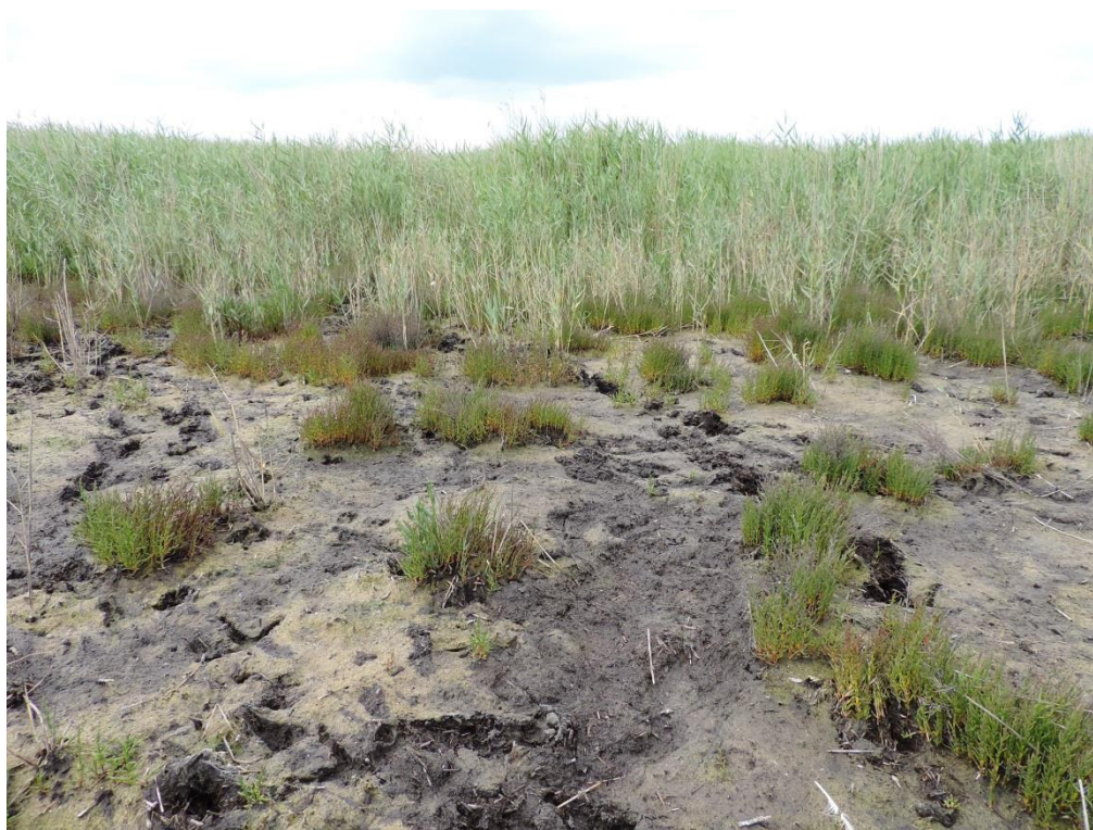
Fot. 16. Słone błota z solirodem zielnym między Kołobrzegiem i Budzistowem

Solnikom zagraża ekspansja trzciny, co jest skutkiem zaniechania ich ekstensywnego użytkowania pastwiskowego i łąkarskiego. Problemem jest także osuszanie łąk i potencjalna presja inwestycyjna w miejscach ich występowania.