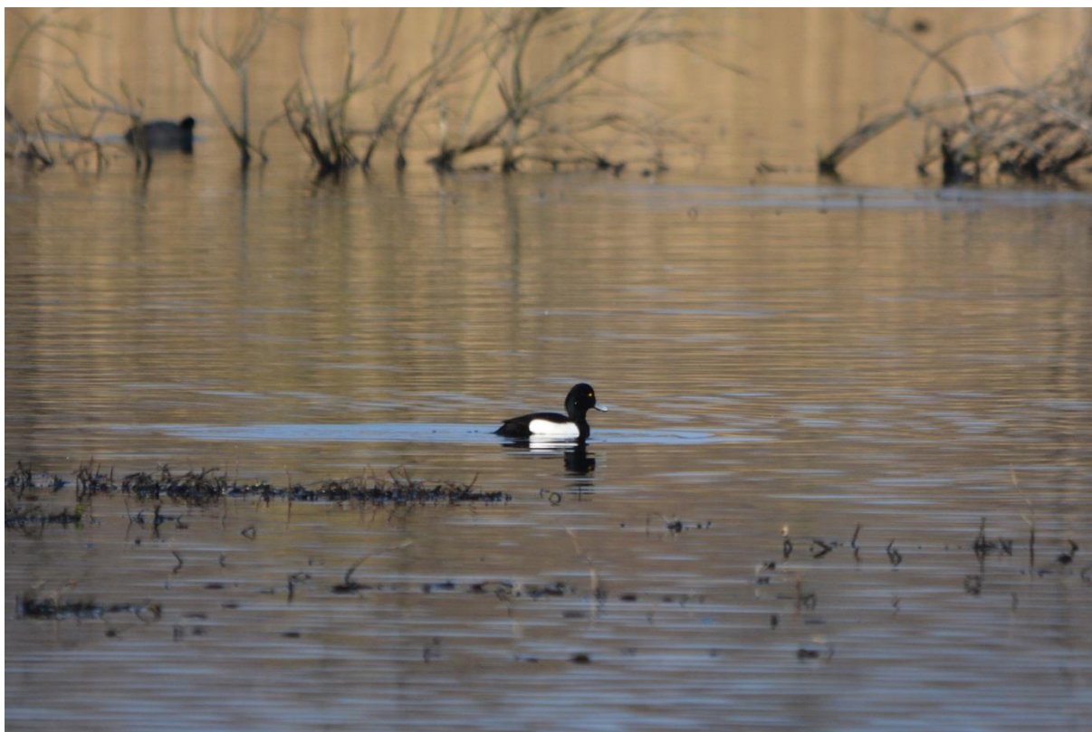
Fot. 32. Czernica Aythya fuligula w Ekoparku

Edredon Somateria mollissima . Zimą 1991/92 na odcinku między Świnoujściem a Kołobrzegiem kilka os. (Tomiałojć, Stawarczyk 2003). W rejonie falochronu w Kołobrzegu 3 os. - 27.11.2013 (forum.przyroda.org). Ochrona ścisła. W 2014 r. nie stwierdzony.