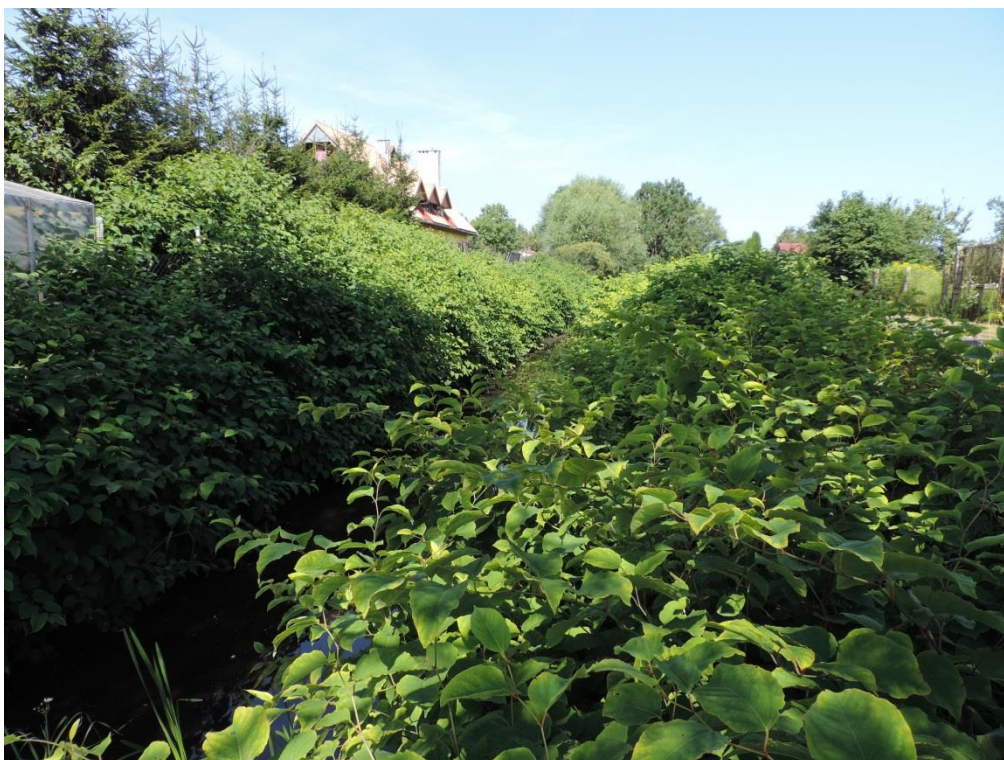
Fot. 7. Rdestowiec krótkokończysty nad Kanałem Drzewnym