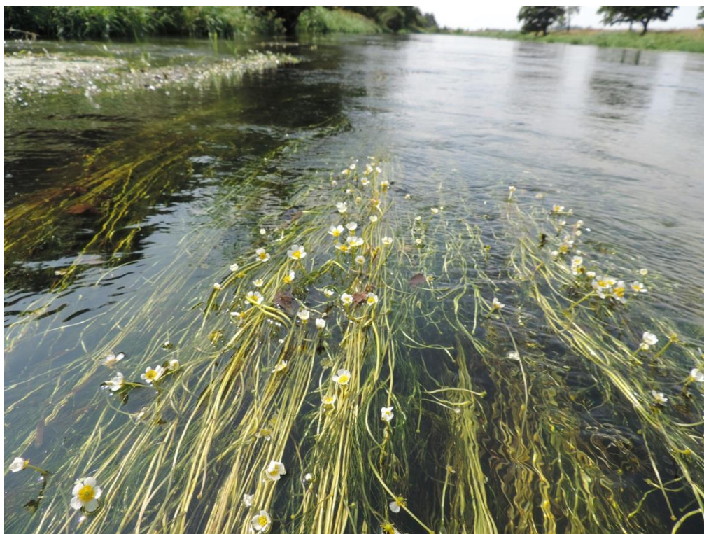
Fot. 18. Parsęta w południowej części miasta – rzeka włosienicznikowa

Rzeki ze zbiorowiskami włosieniczników (kod 3260). Siedlisko to jest związane najczęściej z przyróżłowymi odcinkami cieków, natomiast gminie występuje w Parsęcie w jej odcinku przy południowej granicy miasta. Parsęta na tym odcinku nie ma typowej dla rzek włosienicznikowych postaci jednak występuje tu charakterystyczna dla takich cieków roślinność: włosienicznik rzeczny Batrachium fluitans , rzęśl Callitrichum sp., łączeń baldaszkowaty Butomus umbellatum , grązel żółty Nuphar lutea , jeżogłówki Sparganium sp, wzdłuż szuwarów częsta jest rukiew wodna Nasturtium officinale . Rośliny zielne wykształcają formy specyficzne dla szybko płynących wód – zakorzone w dnie pędy są wielometrowej długości. Siedlisko zagrożone jest przekształceniem hydrotechnicznym rzeki oraz zanieczyszczeniem wód.