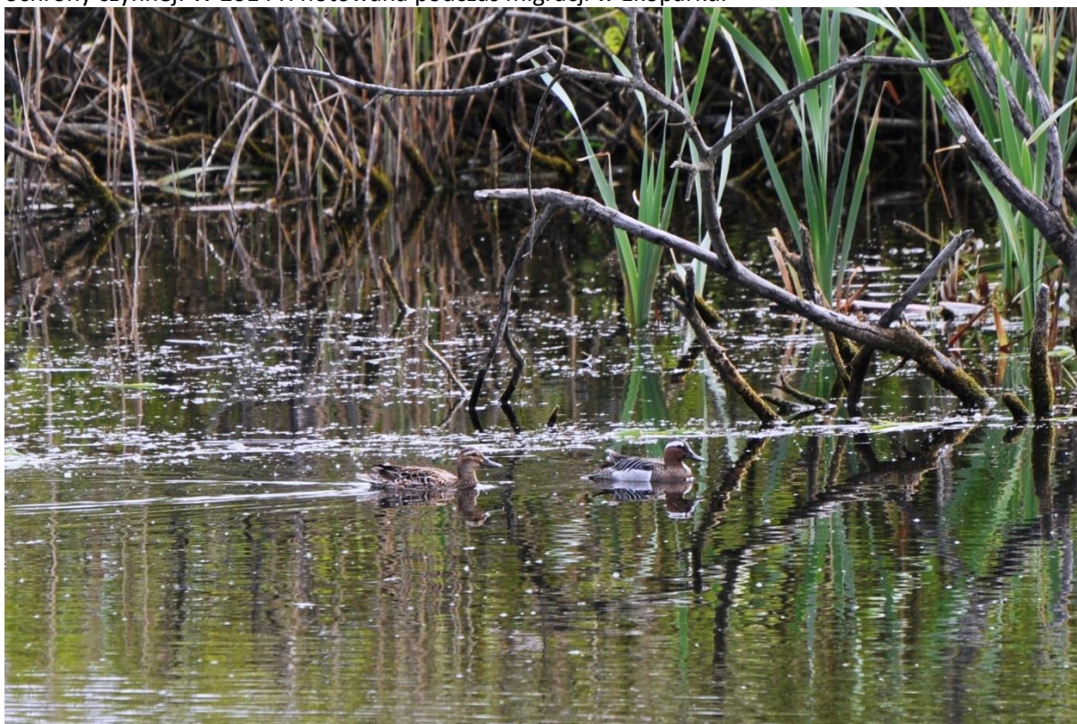
Fot. 31. Cyranka Anas querquedula w Ekoparku

Cyranka Anas querquedula . Podawana jako lęgowa w Ekoparku, zimująca w estuarium Parsęty, a w czasie migracji z falochronów w Kołobrzegu i ich sąsiedztwa (WPMK). W Ekoparku 3 pary lęgowe w 2001 (E. W. Mrugowscy 2001) i para w 2012 (Mrugowski et al. 2012). Ochrona ścisła, wymaga ochrony czynnej. W 2014 r. notowana podczas migracji w Ekoparku.