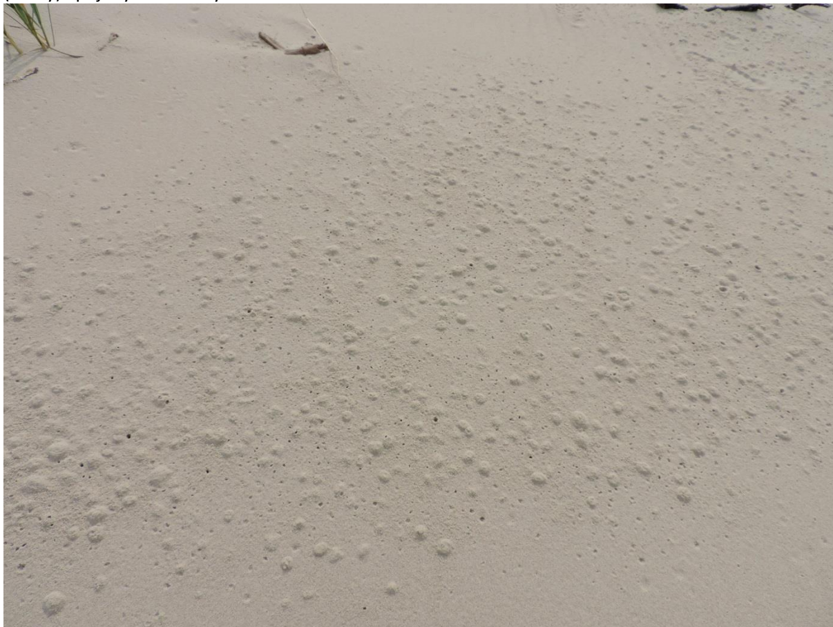
Fot. 29. Zmieraczek plażowy Talitrus saltator

Zmieraczek plażowy Talitrus saltator . Podawany z plaży we wschodniej części Kołobrzegu (PPK). Ochrona częściowa. W 2014 r. odnotowany jedynie na plaży na zachód od falochronu w Kołobrzegu (liczny) i pojedyncze na wysokości ul. Grobla w Podczelu.