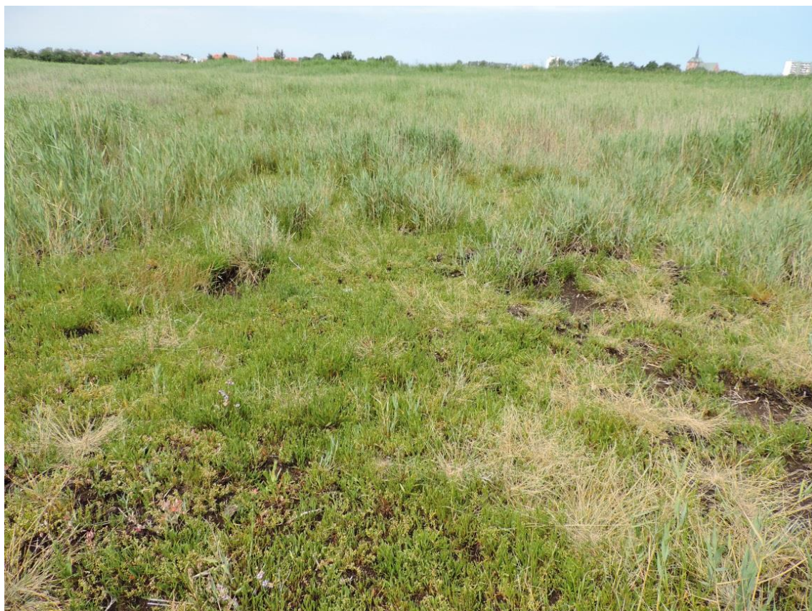
Fot. 39. Solniska w proponowanym rezerwacie Solnisko Kołobrzesckie