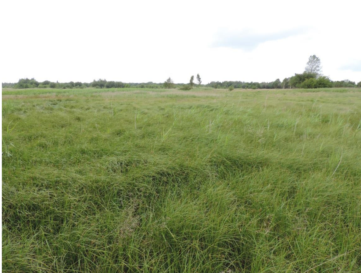
Fot. 41. Szuwary i solniska na Owczym Bagnie