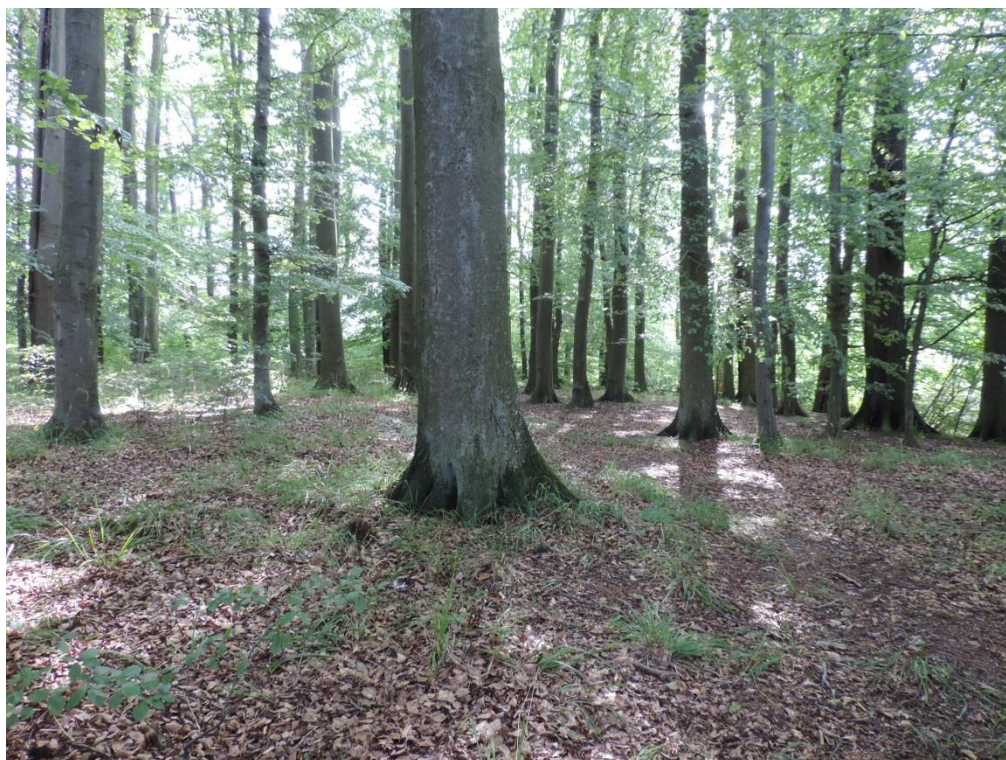
Fot. 38. Buczyna w proponowanym rezerwacie Podczele

Ochroną pomnikową proponuje się chronić pojedyncze drzewa lub grupy osiągające okazałe rozmiary, wyraźnie wyróżniające się wśród innych i spełniające kryteria wielkościowe przyjmowane w skali krajowej. Nie wskazane jest obejmowanie ochroną drzew stosunkowo młodych, przedstawicieli gatunków krótkowiecznych (brzozy, wierzby, topole) i obcych nie posiadających szczególnych walorów, zwłaszcza reprezentujących gatunki inwazyjne (jesion pensylwański, dąb czerwony, świerk sitkajski, topole kanadyjskie – w dotychczasowych materiałach często opisywane jako rodzime topole czarne – tu niewystępujące). Nie proponuje się ochrony pomnikowej na terenach wnioskowanych do ochrony w formie rezerwatu przyrody Podczele. Do czasu utworzenia rezerwatu drzewa zinwentaryzowane na tym terenie przedstawione w załącznikach GIS należy wszakże chronić przed zniszczeniem i wycinką.