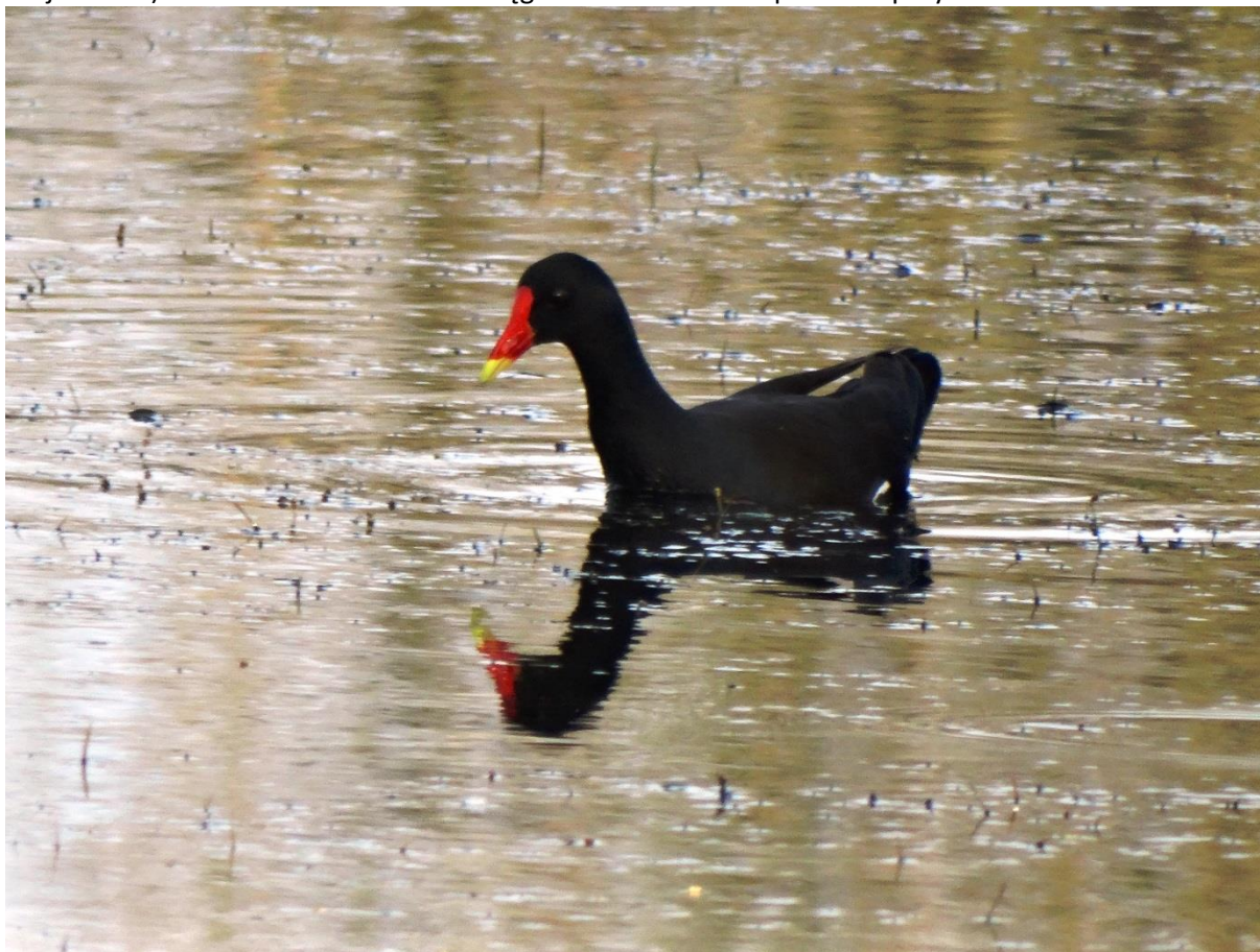
Fot. 34. Kokoszka Gallinula chloropus w Ekoparku

Kokoszka Gallinula chloropus . Podawana z doliny Parsęty (POP), jako lęgowa z Ekoparku (Juszczak, Majca 1997). Ochrona ścisła. W 2014 r. lęgowa na terenie Ekoparku - 2 pary.