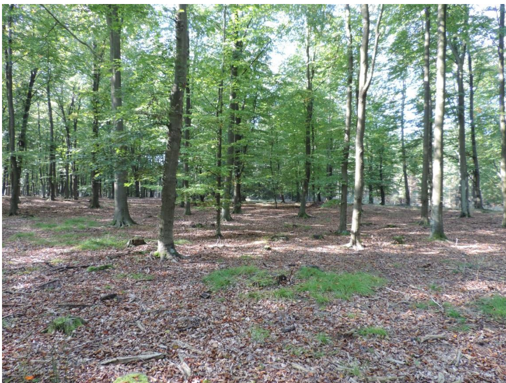
Fot. 11. Kwaśna buczyna koło Podczela