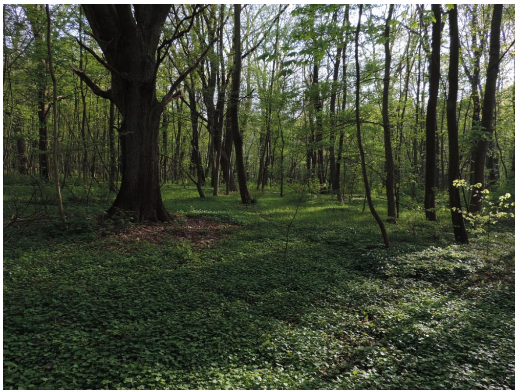
Fot. 23. Park im. A. Fredry

Aleje wzdłuż ulic tworzą platany (aleja pomnikowa), lipy, klony, topole, wiąz i in. Drzewa te często mają powyżej 80-100 lat. W mieście są także pasy zieleni izolacyjnej, w formie nasadzeń drzew o funkcji wiatrochronnej i maskującej obiekty uciążliwe. Pojedyncze lub podwójne szpalery topoli otaczają tereny wojskowe, dawne poligony przy ul. Koszalińskiej, obiekty sportowe przy ul. Śliwińskiego itp. Zieleń izolacyjna występuje wzdłuż rzeki Parsęty – są to głównie wierzby, topole i olsze (Kempińska 2004).