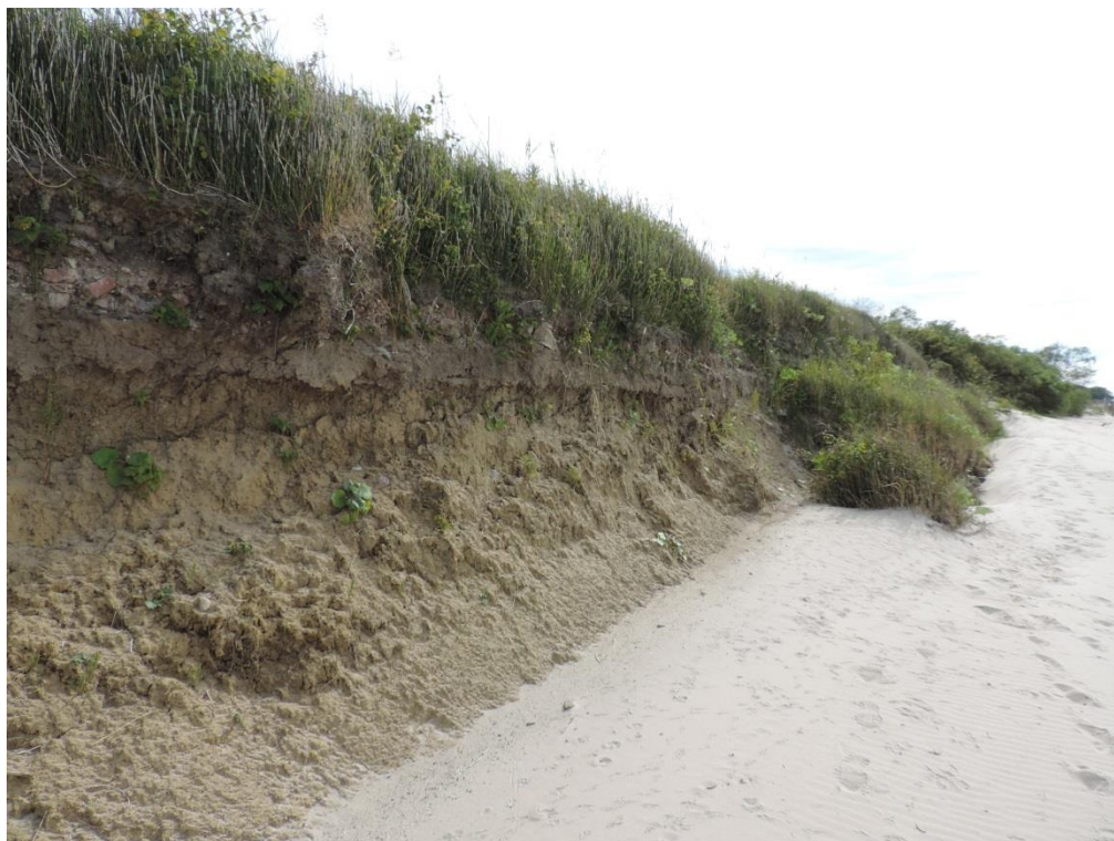
Fot. 14. Klif na wysokości Podczela

Inicjalne zbiorowiska z dominacją podbiału pospolitego Tussilago farfara i ostrożenia polnego Cirsium arvense wykształcają się na gliniastych zboczach klifów. Gatunkom dominującym towarzyszą nielicznie rośliny łąkowe, takie jak: kupkówka pospolita Dactylis glomerata , perz Agropyron repens , stokłosa miękka Bromus hordeaceus , skrzyp polny Equisetum arvense i błotny Eq. palustre . W obrębie płatów zbiorowiska częste są fragmenty darni spełzającej z wierzchowy klifu, bogatsze gatunkowo, z roślinnością łąkową.