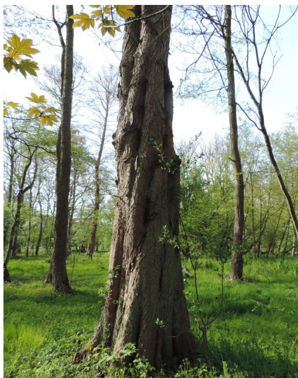
Fot. 36. Cypryśnik błotny – pomnik przyrody w parku im. A. Fredry