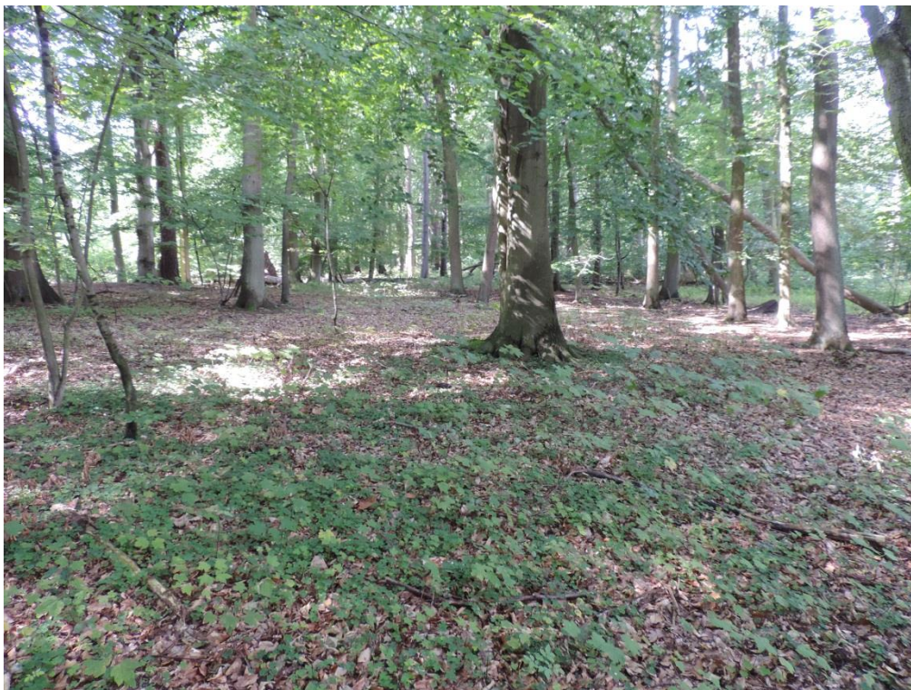
Fot. 10. Żyzna buczyna koło Podczela

Wykształca się na wzniesieniach w „Ekoparku Wschodnim”. Drzewostan jest bukowy, ewentualnie z domieszką dębów i sosen, częściowo siedliska przekształcone są mocniej – pod drzewostanami z dużym udziałem brzoź i świerków. Podszyt raczej słabo rozwinięty, częściej rośnie w nim bez czarny Sambucus nigra . W niezbyt zróżnicowanym runie często rośnie przytulia wonna Galium odoratum i kostrzewa leśna Festuca altissima , poza tym: gajowiec żółty galeobdolon luteum , zawilec gajowy Anemone nemorosa , dąbrówka rozesłana Ajuga reptans , szczawik zajęczy Oxalis acetosella , czyściec leśny Stachys sylvestris .