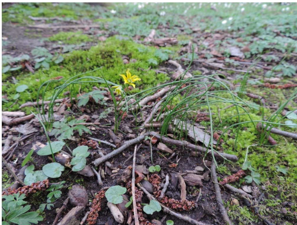
Fot. 4. Złoć pochwowata – gatunek zagrożony, rośnie w lasach wokół Podczela

Szczególnie ważne jest istnienie w obrębie Gminy Miasto Kołobrzeg stanowiska turzyczy wyciągniętej Carex extensa – gatunku uznanego za wymarły w Polsce, ponownie odkrytego na solnisku między Kołobrzegiem a Budzistowem (Bosiacka, Więclaw 2012). Z gatunków zagrożonych w skali krajowej w obrębie miasta występują poza tym: złoć pochwowata (las wokół Podczela), sit tępokwiatowy i jarnik solankowy (Owczę Bagno), ostrzew rudy i babka nadmorska (solniska na południe od miasta).