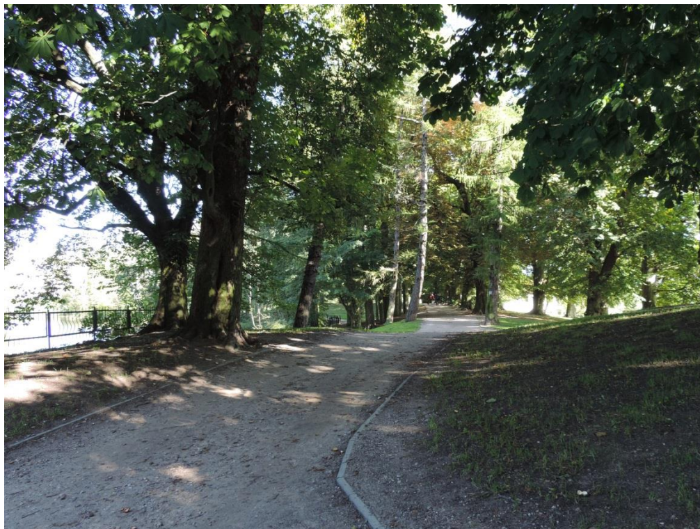
Fot. 24. Park im. J.H. Dąbrowskiego

Ze względu na nieocenione znaczenie terenów zieleni dla walorów uzdrowiskowo-turystycznych miasta Kołobrzeg oraz ich znaczące walory, zasługują one na szczególną uwagę w zakresie nie tylko ich ochrony, ale też utrzymania wysokich standardów także w warunkach rozwoju miasta. Zdecydowanie nie wystarczająca jest w przypadku Kołobrzegu ochrona zieleni w sensie konserwatorskim – konieczny jest jej rozwój bazujący na specyficznych cechach kompozycji, składu i funkcji.