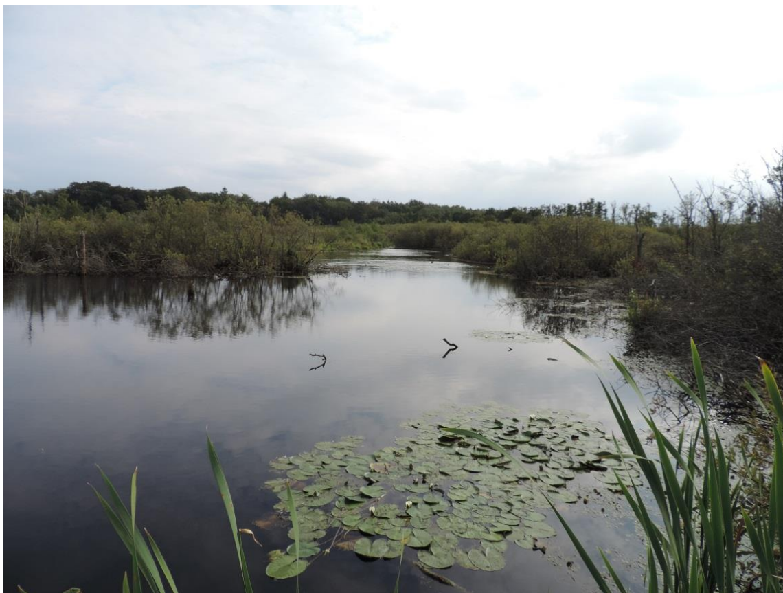
Fot. 40. Rozlewiska w użytku ekologicznym Ekopark