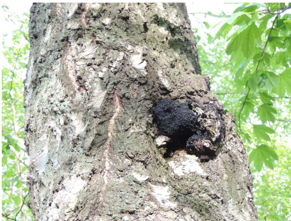
Fot. 21. Błyskoporek podkorowy w parku im. A. Fredry