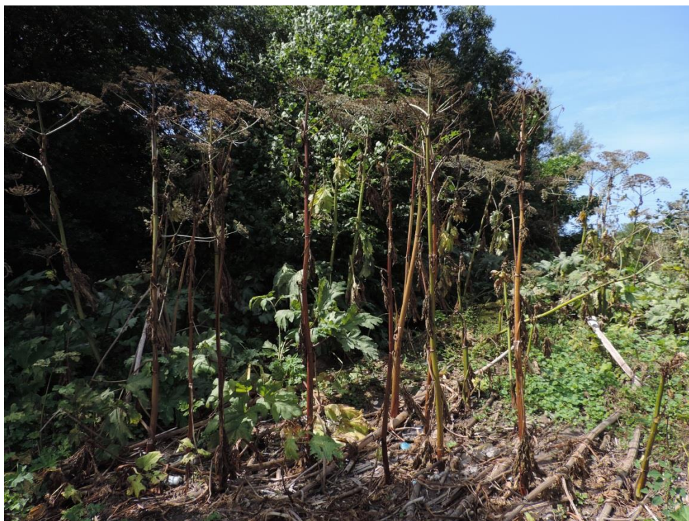
Fot. 6. Barszcz Sosnowskiego w południowej części miasta przy ul. 6 Dywizji Piechoty

*Rumianki - Chamomilla sp. *Rzepik pospolity - Agrimonia eupatoria Sałaty - Lactuca sp. *Skrzyp polny (!) - Equisetum arvense *Sosna zwyczajna (!) - Pinus sylvestris Starce - Senecio sp. Stulisze - Sisymbrium sp. Szczawie (!) - Rumex sp. Szczawik zajęczy (!) - Oxalis acetosella *Śliwa tarnina - Prunus spinosa Świerżabek gajowy - Chaerophyllum temulum Świerzbica polna - Knautia arvensis Tasznik pospolity (!) - Capsella bursa-pastoris Tatarak zwyczajny - Acorus calamus Tojeść rozestłana - Lysimachia nummularia Wierzby - Salix sp. Wierzbówka koprzyca - Chamaenerion angustifolium Wiesiołek dwuletni - Oenothera biennis Wrotycz pospolity (!) - Tanacetum vulgare Żywokost lekarski - Symphytum officinale