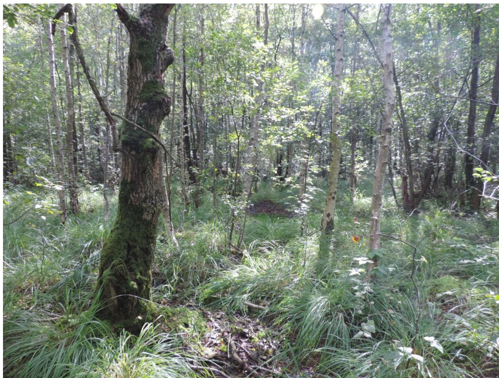
Fot. 19. Niewielki płat brzeziny bagiennej na zachód od Podczela

Grąd subatlantycki Stellario-Carpinetum (kod 9160). Żyzne lub średniożyzne, wielogatunkowe lasy liściaste. W drzewostanie dominuje najczęściej buk Fagus sylvatica , grab Carpinus betulus , dąb szypułkowy Quercus robur , czasem także wiązy Ulmus sp. , olsza czarna Alnus glutinosa , jesion wyniosły Fraxinus excelsior i specyficzne dla tutejszych lasów – okazałe czereśnie Prunus avium . W często dobrze wykształconej warstwie krzewów dominuje zwykle leszczyna Corylus avellana , trzmielina pospolita Euonymus europaea i głóg jednoszyjkowy Crataegus monogyna . Bogate runo składa się z gatunków typowych dla lasów dębowo-grabowych, największe znaczenie diagnostyczne dla grądu subatlantyckiego ma gwiazdnica wielkokwiatowa Stellaria holostea . Skład gatunkowy runa jest zmienny w zależności od żyzności i wilgotności siedliska. Grądy te zajmują podnóża wzniesień morenowych, młode zbocza dolin rzecznych oraz obniżenia i dna dolin poza zasięgiem zalewów. Występują na dużej powierzchni w lasach otaczających Podczelę.