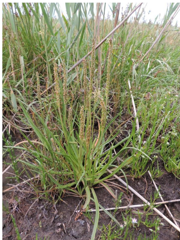
Fot. 2. Babka nadmorska – gatunek pod ochroną ścisłą na solniku m. Kołobrzegiem i Budzistowem