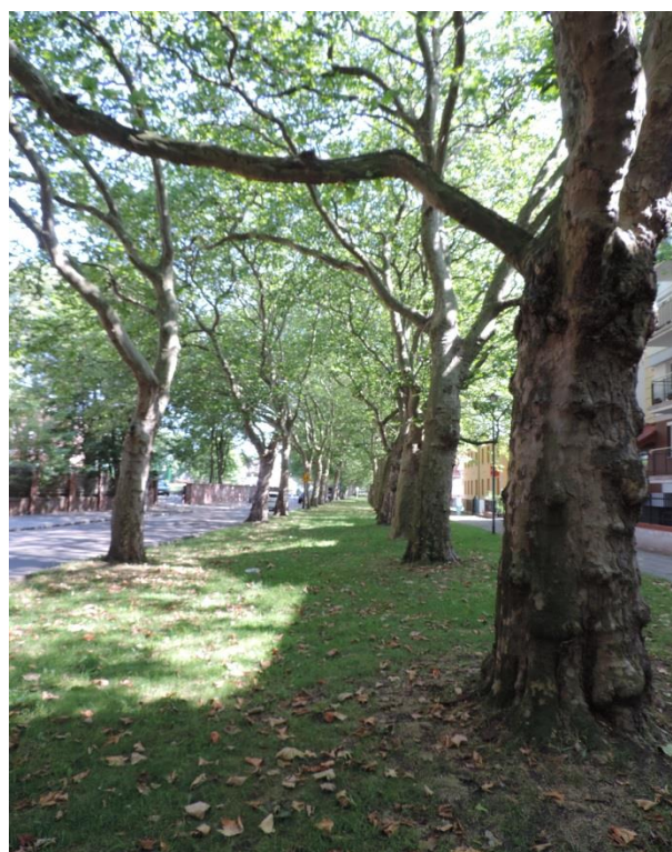
Fot. 37. Pomnikowa alej platanów na ul. Łopuskiego