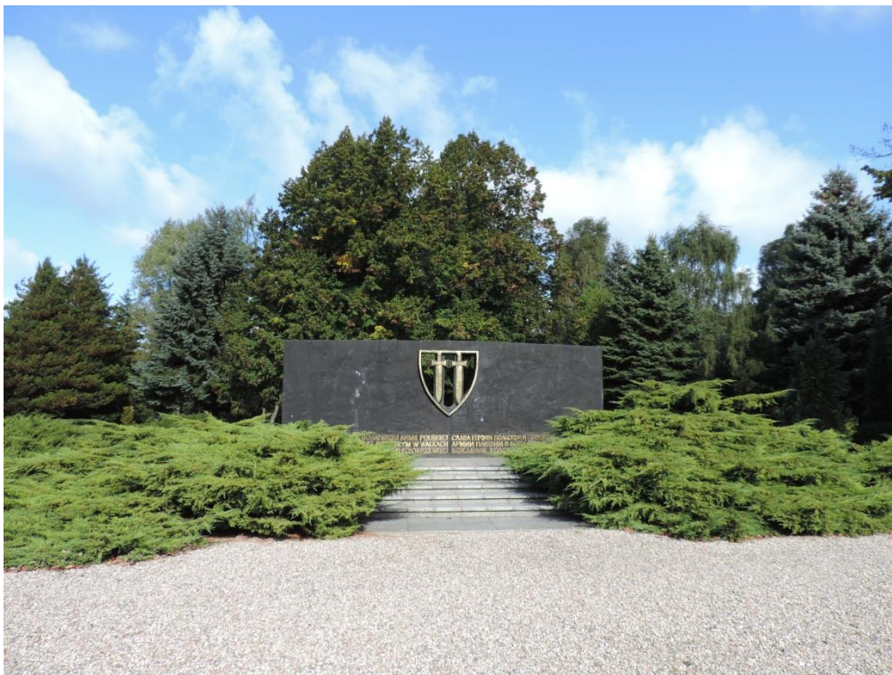
Fot. 26. Cmentarz wojenny w Kołobrzegu

W mieście znajduje się również skwer z pomnikowymi lipami drobnolistnymi, bylinami ozdobnymi i strzyżonymi żywopłotami przy mogile jeńców francuskich między Bulwarem Marynarzy Okrętów Pogranicza i ul. Frankowskiego.