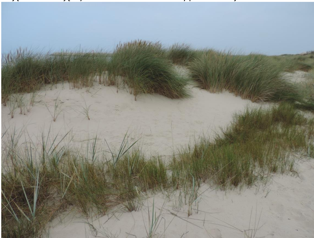
Fot. 15. Murawy z piaskownicą, wydmuchrzą i kostrzewą czerwoną na terenie wojskowym przy ujściu Parsęty

Zbiorowisko wykształcające się u podnóży klifu, stabilizujące białe i szare wydmy. Najlepiej wykształcone na brzegu morskim w obrębie stacji bazowania wojsk na zachód od ujścia Parsęty. Poza tym porasta wydmy przednie i białe w części zachodniej gminy, fragmentarycznie w części wschodniej. Charakterystyczną fizjonomię nadają zbiorowisku trawy – piaskownica zwyczajna Ammophila arenaria , trzcinnikownica nadbrzeżna Calammophila x baltica i wydmuchrzyca piaskowa Leymus arenarius . Gatunkom tym rzadko towarzyszą: bylica polna Artemisia campestris , rdest kędzierzawy Cirsum crispus , honkenia piaskowa Honckenya peploides , rukwiel nadmorska Cakile maritima , solanka kolczysta Salsola kali . Fazę degeneracyjną tworzą zbiorowiska zarastające inwazyjną wierzbą wawrzynkową Salix daphnoides oraz różą pomarszczoną Rosa rugosa , przyspieszające stabilizację wydym i kształtowanie warstwy próchnicznej.